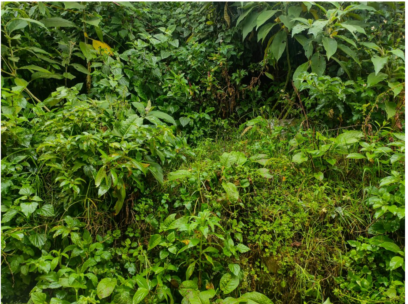
Afbeelding 1. Diverse planten. Planten zijn er in alle soorten en maten, maar alle

Planten zijn vreemd. Ze lijken niet veel te doen, maar toch is bijna elk levend organisme op aarde afhankelijk van ze om te overleven. Biologen bestuderen planten al eeuwen, maar vanuit de natuurkunde is er historisch gezien niet veel onderzoek gedaan naar deze organismen. Als mensen denken aan natuurkundig onderzoek, denken ze vooral aan zwarte gaten, neutronensterren of quantummechanica. Natuurkunde kan ons daarnaast echter ook helpen om biologische systemen te begrijpen en dit is precies waar het onderzoeksveld van de biofysica zich mee bezighoudt.