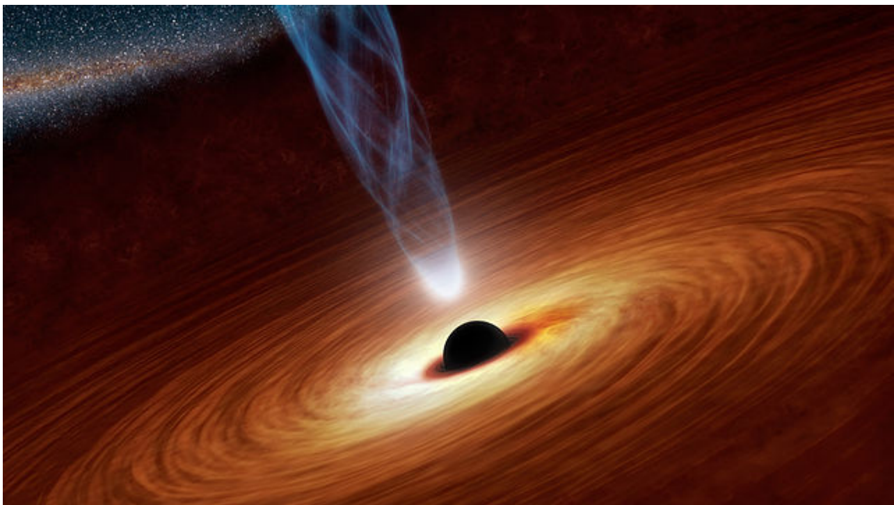
Afbeelding 2. Een zwart gat. Allerlei zaken die we bij echte zwarte gaten niet kunnen waarnemen, zoals de Hawkingstraling, kunnen mogelijk bij analogieën van zwarte gaten wel worden waargenomen.

Wanneer de quantummechanische effecten van de spontane creatie van deeltjes en antideeltjes in de ruimte worden meegewogen, blijkt dat het kan gebeuren dat bijvoorbeeld de antideeltjes worden opgeslokt door het zwarte gat en de deeltjes deze dans ontspringen. Deze deeltjes veroorzaken straling die we Hawkingstraling noemen. Hawkingstraling is nog nooit gemeten bij zwarte gaten, maar wie weet zou dat wel kunnen bij analogieën ervan!