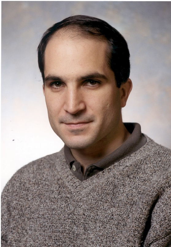
Afbeelding 4. Juan Maldacena.

Paren van natuurkundige modellen die dual zijn, liggen beslist niet voor het oprapen. De eerste die zo'n bijzonder paar van modellen vond, was de Argentijn Juan Maldacena. Hij deed dat in 1997 - toevallig het jaar waarin Hawking, Thorne en Preskill ook hun weddenschap afsloten.