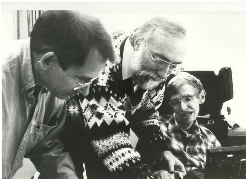
Afbeelding 1. John Preskill, Kip Thorne en Stephen Hawking. Hawking, Preskill en Thorne sloten in 1997 een