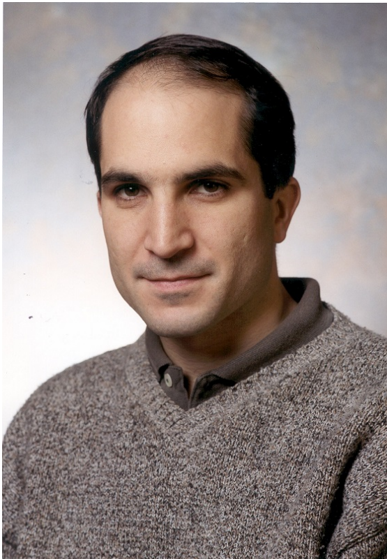
Afbeelding 4. Juan Maldacena.

Paren van natuurkundige modellen die dual zijn, liggen beslist niet voor het oprapen. De eerste die zo'n bijzonder paar van modellen vond, was de Argentijn Juan Maldacena. Hij deed dat in 1997 - toevallig het jaar waarin Hawking, Thorne en Preskill ook hun weddenschap afsloten.