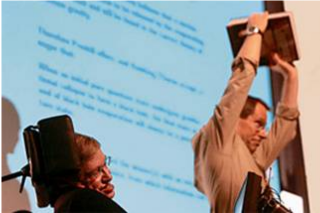
Afbeelding 6. De verliezer en de winnaar. John Preskill houdt de encyclopedie omhoog die hij zojuist van Stephen Hawking ontvangen heeft voor de gewonnen weddenschap.

twijfelen. Dat gold ook voor Stephen Hawking. Hij was er in 2004 zodanig van overtuigd dat het idee van Maldacena juist was, en dat zwarte gaten dus geen informatie konden vernietigen, dat hij de weddenschap opgaf. Zoals beloofd gaf hij John Preskill, de winnaar van de weddenschap, daarom een encyclopedie: 'Total Baseball, the Ultimate Baseball Encyclopedia'.