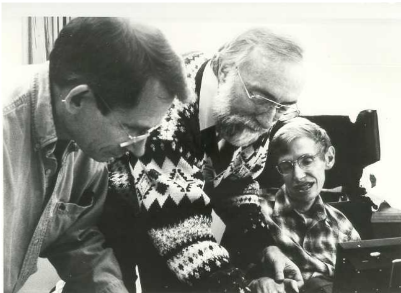
Afbeelding 1. John Preskill, Kip Thorne en Stephen Hawking. Hawking, Preskill en Thorne sloten in 1997 een