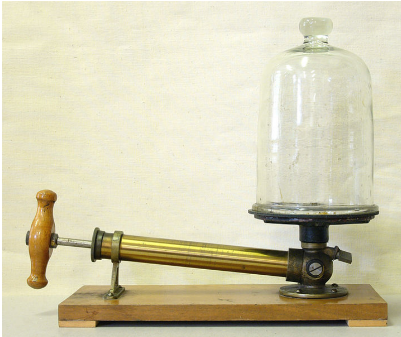
Afbeelding 1. Een klassieke vacuümpomp. In de klassieke natuurkunde wordt een vacuüm gezien als een stuk ruimte dat helemaal leeg is. In de quantummechanica blijkt een vacuüm echter nooit helemaal leeg: het bevat altijd velden, en er ontstaan en verdwijnen continu deeltjes.

Quantummechanica is bovendien een theorie van kansprocessen . Er bestaat geen toestand waarin alle quantumvelden volkomen in rust zijn en dat voor altijd blijven: er is altijd een kans dat in een verder lege ruimte een veld ineens een trilling vertoont, en dat er daardoor bijvoorbeeld twee deeltjes ontstaan. Een enkel deeltje kan in het algemeen niet ontstaan, omdat er in de natuur allerlei behoudswetten zijn. Denk aan het behoud van lading: als er uit het niets een deeltje met positieve lading ontstaat, zal er tegelijkertijd een deeltje met negatieve lading moeten ontstaan. Zo gelden er veel meer behoudswetten; het resultaat is dat een deeltje altijd alleen tegelijk met zijn antideeltje , met al die eigenschappen tegengesteld, kan ontstaan.