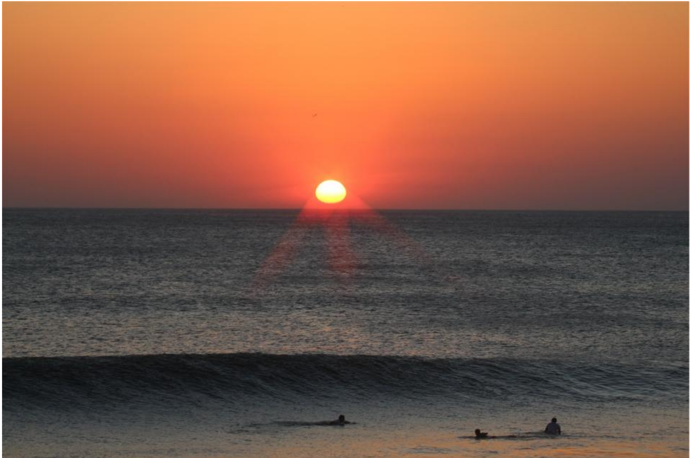
Afbeelding 3. De horizon. Net als het aardoppervlak heeft ook een zwart gat een horizon: een denkbeeldige grens van waarachter geen licht naar ons toe kan komen.