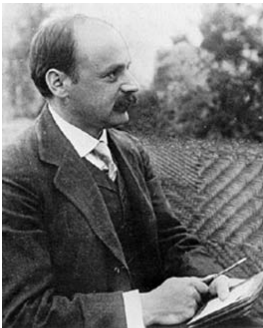
Afbeelding 2. Karl Schwarzschild (1873-1916).

In het vorige artikel zagen we dat een zwart gat ontstaat als licht niet meer aan een zwaar object kan ontsnappen. In dat geval moet de ontsnappingsnelheid dus gelijk zijn aan de lichtsnelheid, zo'n 300.000 kilometer per seconde (oftewel 3,00 \times 10^8 m/s). We geven deze snelheid vaak aan met het symbool c . Uit de formule in het vorige hoofdstukje zien we dat er twee manieren zijn om de ontsnappingsnelheid zo hoog te maken: we moeten ofwel een heel zwaar object creëren (dan wordt de massa M heel groot), of we moeten zorgen dat een bepaalde hoeveelheid massa zich in een heel klein gebied bevindt, zodat we de afstand r tot het centrum van die massa heel klein kunnen maken.