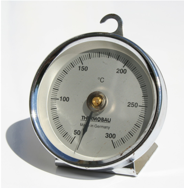
Afbeelding 1. Temperatuur. Voorwerpen die straling uitzenden (zoals een warme oven) hebben daarmee ook een temperatuur. Ook zwarte gaten zenden straling uit - de beroemde Hawkingstraling - en ook van een zwart gat zouden we dus de temperatuur moeten kunnen bepalen.