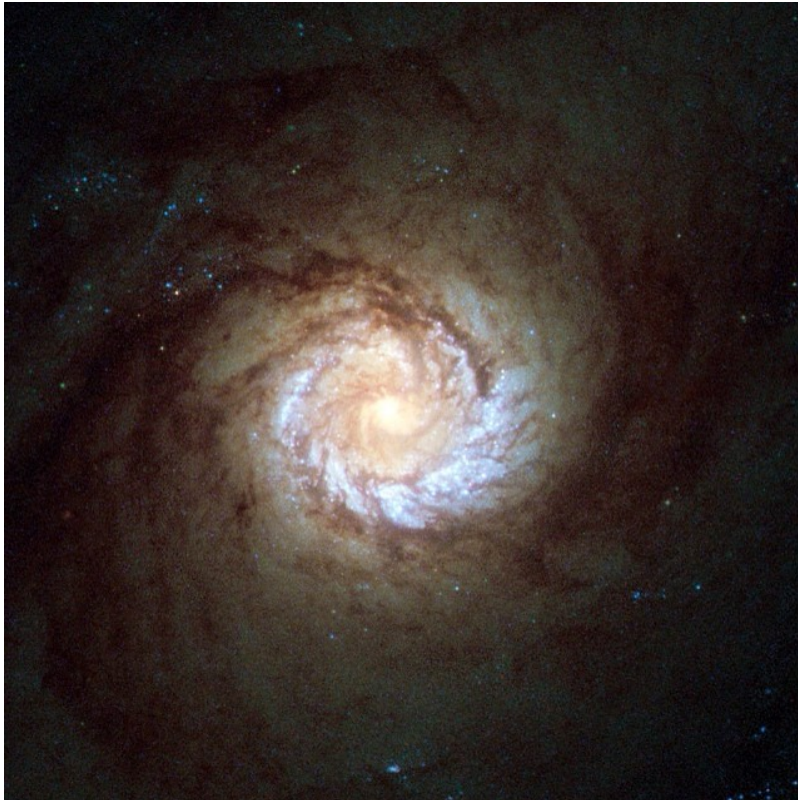
Afbeelding 5. M61. We kunnen zwarte gaten niet direct zien, maar de gevolgen van hun aanwezigheid worden tegenwoordig op veel plaatsen in het heelal waargenomen. Hier het sterrenstelsel M61, waarvan gedacht wordt dat de kern een enorm zwart gat bevat.

hand. Zo zien we de tijd op de rand van een zwart gat bijvoorbeeld stilstaan!