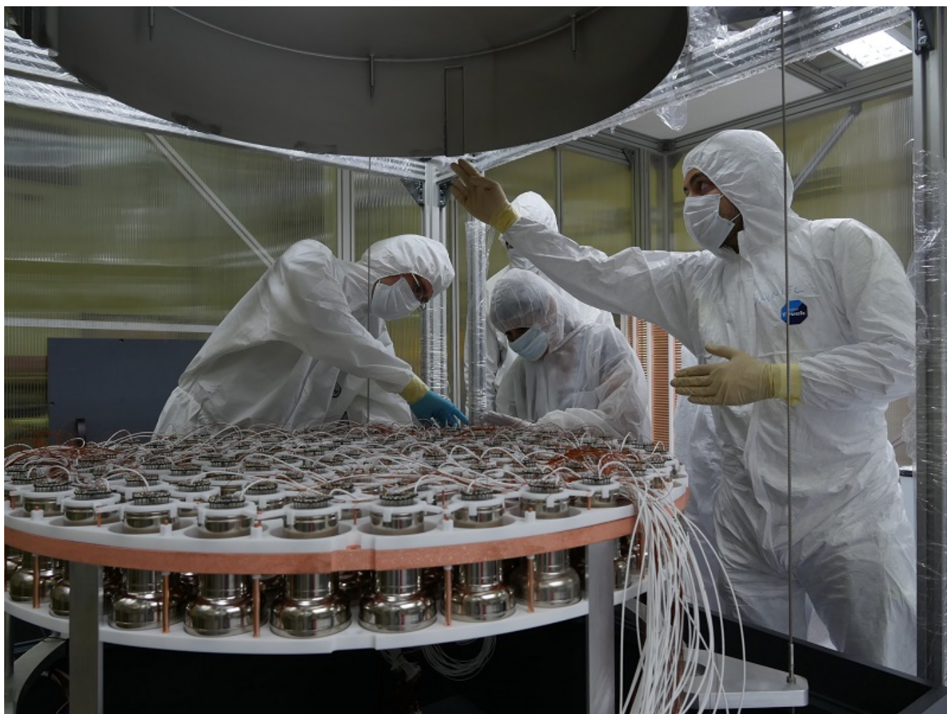
Afbeelding 2. De detectoren. De detectoren waarmee de lichtflitsjes worden waargenomen, worden geïnstalleerd.