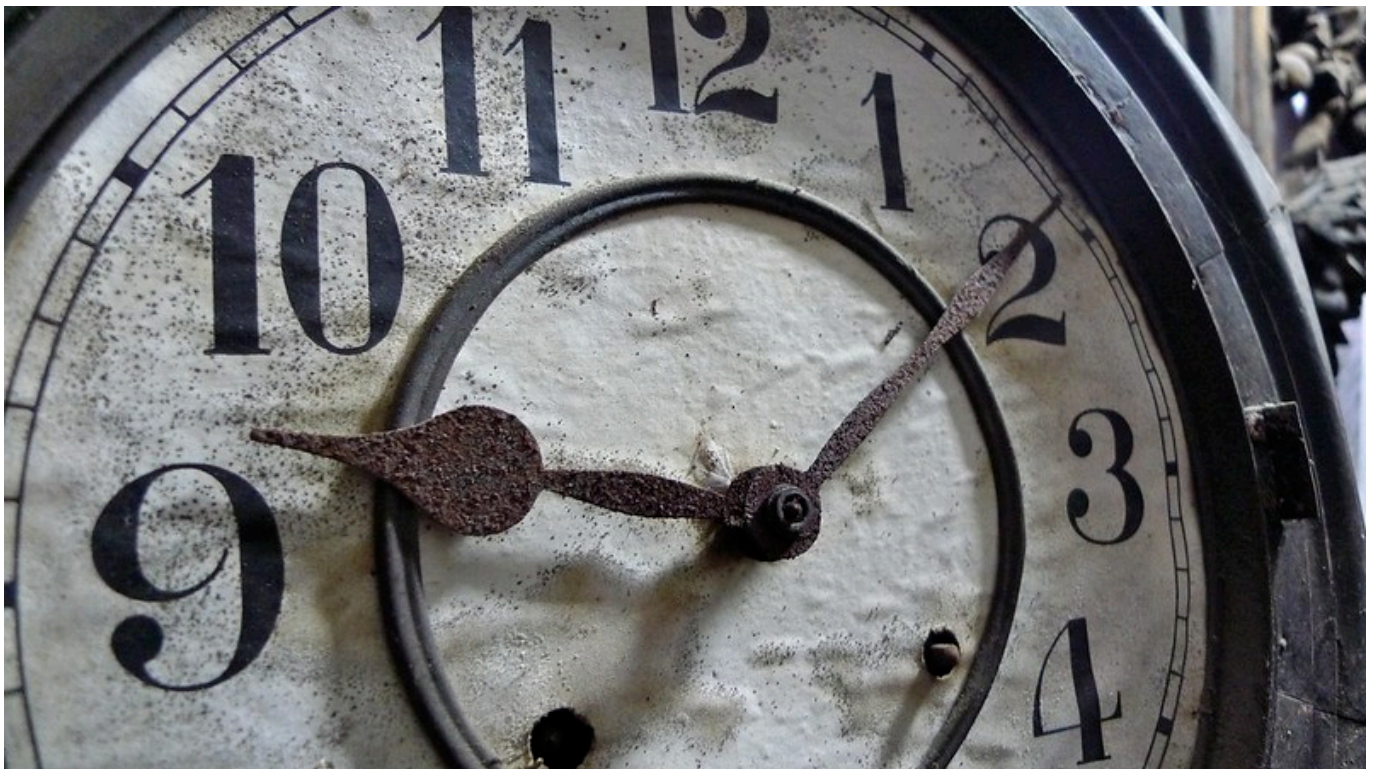
Afbeelding 1. Een klok.

Tijdreizen naar de toekomst is volgens de relativiteitstheorie van Albert Einstein mogelijk, maar hoe zit dat met tijdreizen naar het verleden? In dit artikel bespreek ik een speculatief idee om wormgaten - mysterieuze verbindingen in de ruimtetijd - te gebruiken als tijdachines naar het verleden.