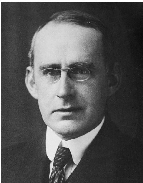
Afbeelding 2. Arthur Eddington (1882-1944).

door de zon te meten. Dit idee werd echter veel later weer belangrijk, toen Albert Einstein nadacht over manieren om zijn algemene relativiteitstheorie te testen. Zoals elders op deze site te lezen is, beschrijft deze theorie de aantrekking door massa op een fundamenteel andere manier dan die van Newton dat deed. Volgens Einstein oefent een zware massa geen kracht uit op andere deeltjes, maar kromt hij de ruimte waarin deze deeltjes bewegen. Zijn berekening leidt zo op een heel andere manier tot een hoek van afbuiging langs de zon. De hoek die Einstein vond is precies twee keer zo groot is als de uitkomst van Newton's wetten.