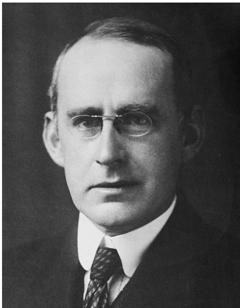
Afbeelding 2. Arthur Eddington (1882-1944).

door de zon te meten. Dit idee werd echter veel later weer belangrijk, toen Albert Einstein nadacht over manieren om zijn algemene relativiteitstheorie te testen. Zoals elders op deze site te lezen is, beschrijft deze theorie de aantrekking door massa op een fundamenteel andere manier dan die van Newton dat deed. Volgens Einstein oefent een zware massa geen kracht uit op andere deeltjes, maar kromt hij de ruimte waarin deze deeltjes bewegen. Zijn berekening leidt zo op een heel andere manier tot een hoek van afbuiging langs de zon. De hoek die Einstein vond is precies twee keer zo groot is als de uitkomst van Newton's wetten.