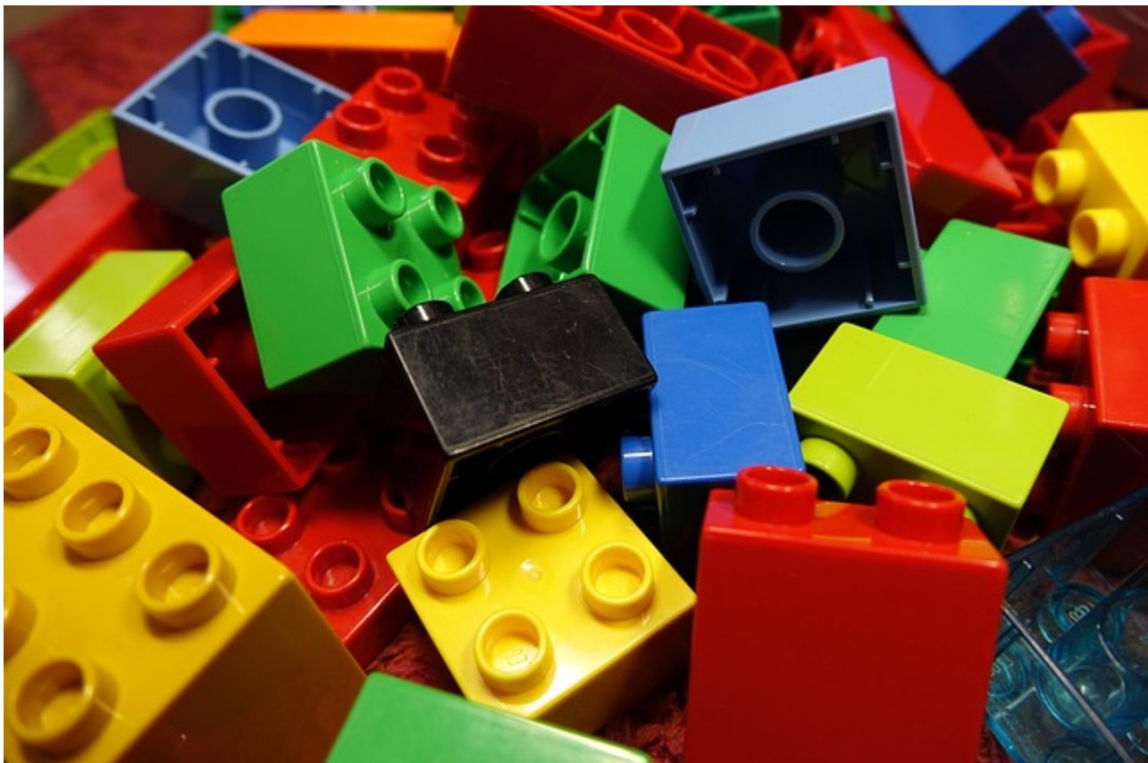
Afbeelding 1. Kennen we alle elementaire bouwstenen van materie? Weten we precies uit welke 'legoblokjes'

Kennen we alle elementaire bouwstenen van materie?