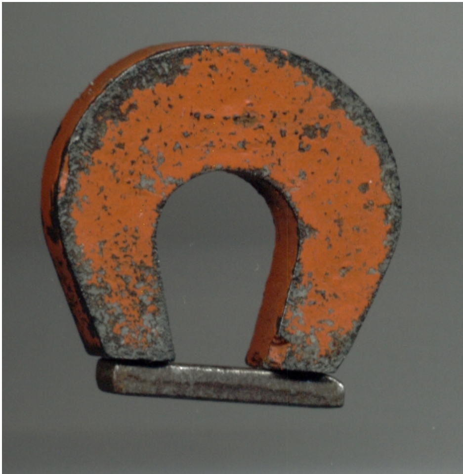
Afbeelding 4. Krachten. De kracht waarmee een magneet een stuk metaal optilt is een voorbeeld van de elektromagnetische kracht, één van de drie natuurkrachten die voor de interacties tussen elementaire deeltjes een belangrijke rol spelen.

zogenaamde boodschapper- of krachtdeeltjes. Van de eigenschap ‘elektrische lading’ en bijbehorende elektromagnetische kracht, leren we op school het basisprincipe dat deeltjes die dezelfde (verschillende) lading hebben elkaar afstoten (aantrekken). In de quantummechanische beschrijving van diezelfde kracht weten we nu dat dat gebeurt door de uitwisseling van de krachtdeeltjes van die kracht: fotonen. Maar naast elektrische lading hebben deeltjes nog twee eigenschappen die van belang zijn voor hun communicatie met andere deeltjes, namelijk ‘zwakke isospin ’ en ‘ kleur ’. Die eigenschappen zijn gekoppeld aan respectievelijk de zwakke en de sterke kernkracht. Ook daar zijn er krachtdeeltjes, de W- en Z-bosonen (zwakke kracht) en de gluonen (sterke kracht), die dicteren hoe deeltjes op elkaar reageren.