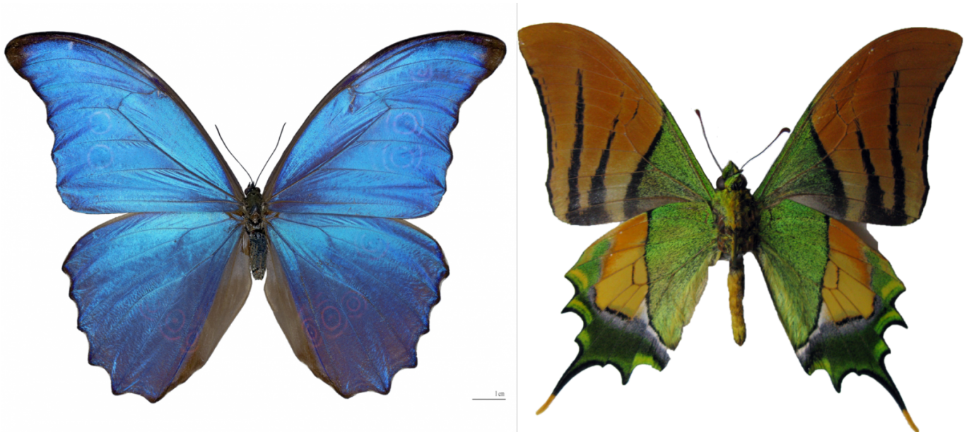
Afbeelding 2. Twee felgekleurde vlinders. Links: Morpho didius. Rechts: Teinopalpus imperialis.

Om dit te begrijpen moeten we kijken naar de structuur van de vleugels. Vlinders en motten vallen in de orde Lepidoptera , een term die bestaat uit de Griekse woorden voor schub ('lepidos') en vleugel ('pteron'). Ze heten niet voor niets zo: hun vleugels zijn bedekt met duizenden minuscule schubben. Sommige vlinders zijn extra speciaal, omdat hun schubben zelf ook nog eens een bijzondere microstructuur hebben. Dagpauwogen hebben bijvoorbeeld strepen bovenop hun schubben - zie afbeelding 3.