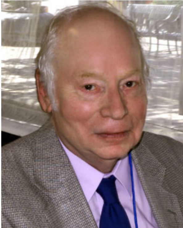
Afbeelding 3. Steven Weinberg. Foto van Weinberg (1933-2021) genomen tijdens het Texas Book Festival in Austin.

QFT toen Weinberg quantumelectrodynamica (QFT toegepast op het electromagnetisme) aanhaalde als voorbeeld van een lelijke theorie. Op deze manier beargumenteert Weinberg waarom theoretisch fysici zo sterk vertrouwen blijven houden in hun theorieën en in het belang ervan en waarom politici hen daarin zouden moeten volgen.