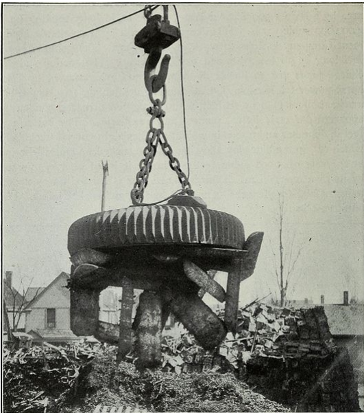
Afbeelding 1. Een magneet tilt ijzerafval op. Doordat de zwaartekracht zo zwak is, kan een magneet de zwaartekracht van de aarde overwinnen.

Ondanks het feit dat zwaartekracht een belangrijke rol speelt in het dagelijks leven, is het een zeer zwakke kracht. Stel je maar eens voor dat je met een magneet je sleutelbos optilt. De aarde trekt met zijn gigantische massa van 6 \times 10^{24} kg aan de sleutelbos, maar toch is de kracht die een kleine magneet uitoefent sterker en wint die kracht het van de zwaartekracht! In dit artikel zullen we zien dat dit misschien geen toevalligheid is, maar dat er een verklaring zou kunnen zijn voor het feit dat de zwaartekracht zo zwak is in ons universum.