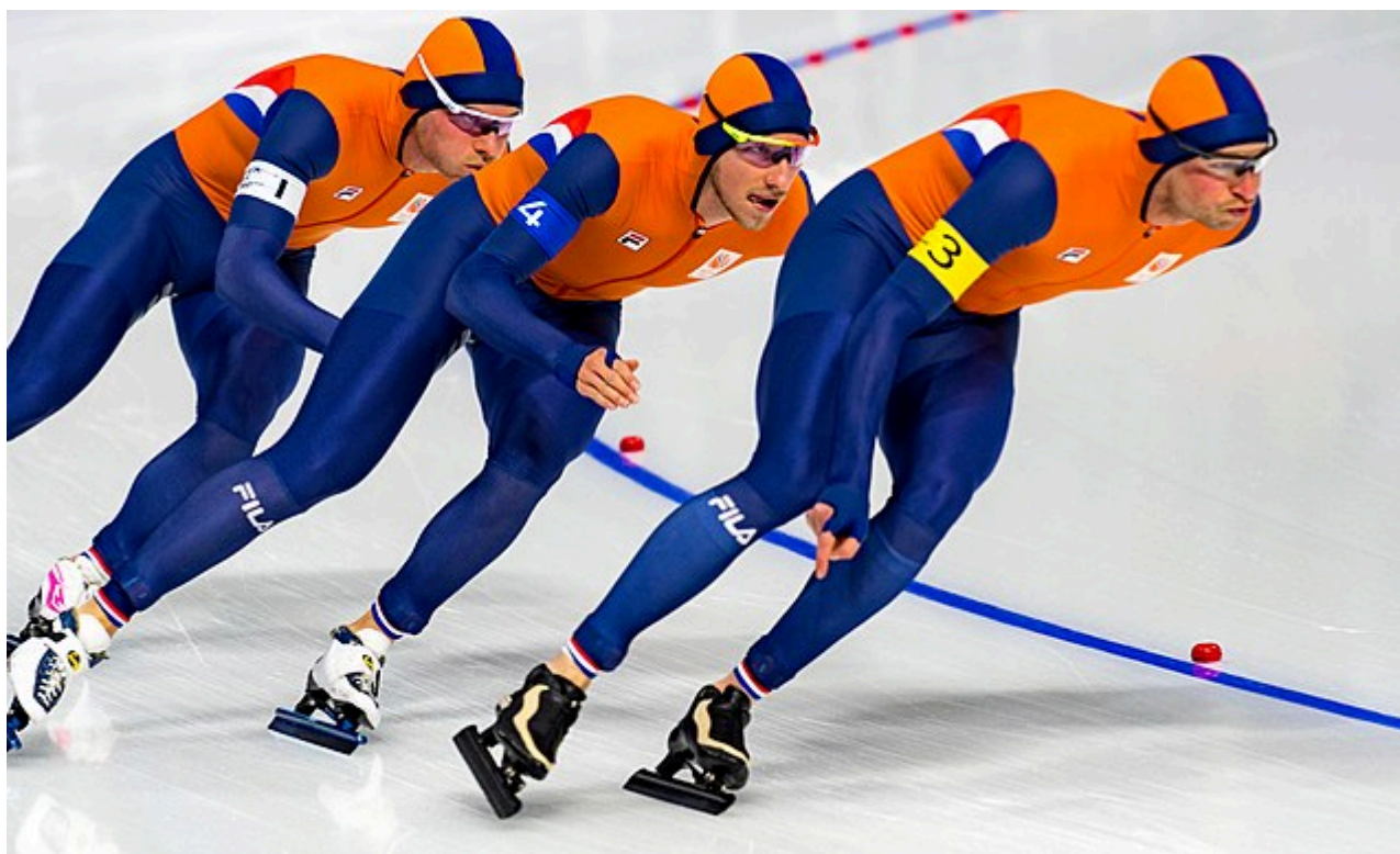
Afbeelding 1. Schaatsen. Zoals helaas ook Nederlandse topschaatsers weten, is ijs glad. Maar waarom is dat zo?

Ledereen weet dat glijden op ijs of sneeuw veel eenvoudiger gaat dan op de meeste andere oppervlakken. Maar waarom is ijs glad? Die vraag houdt wetenschappers al meer dan een eeuw bezig, en is nog altijd onderwerp van discussie. Onderzoekers van de Universiteit van Amsterdam, Amolf en het Max Planck Institute for Polymer Research in Mainz hebben nu aangetoond dat de gladheid van ijs een gevolg is van het gemak waarmee de bovenste watermoleculen over het ijsoppervlak kunnen rollen.