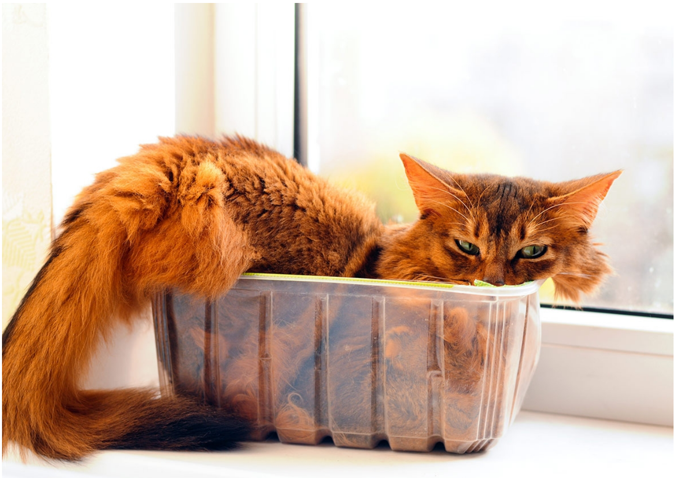
Afbeelding 1. Een kat neemt de vorm aan van een bakje.

Iedereen kent de leuke plaatjes op internet van katten die zich in veel te kleine ruimtes proppen of die houdingen aannemen die op circus trucjes lijken. In 2013 werd er op de website boredpanda.com een collectie foto's geplaatst die moest bewijzen dat katten vloeibaar zijn. Deze post inspireerde natuurkundige Marc-Antoine Fardin om reologie te gebruiken om te controleren of dit waar is. Voor dat onderzoek heeft hij in 2017 de Ig Nobelprijs gewonnen.