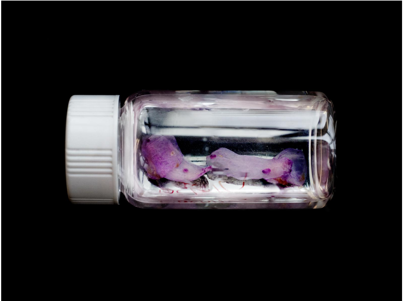
Afbeelding 3. Een monster van een muizenborstklier, gebruikt voor onderzoek naar de initiatie en progressie van kanker.

Het vierde deel van het boek richt zich op het onderzoek waarin data en algoritmes een belangrijke rol spelen. Tegenwoordig komt dit natuurlijk steeds vaker voor, in alle soorten wetenschap. Als al het onderzoek in een computer gedaan wordt, is het natuurlijk moeilijk om te fotograferen. Jansen kreeg de kans om de Amsterdam Data Tower in het Science Park van binnen te zien: een 72 meter hoge toren met wel 5000 vierkante meter aan data-opslag. De steriele witte gangen die Jansen vastlegde lijken rechtstreeks uit een sciencefictionfilm te komen (afbeelding 4). Naast deze foto's is er een reeks afbeeldingen van wat verschillende lagen van een 'deep neural network' zien als ze een foto van een kat interpreteren. Hiermee hopen onderzoekers computers beter te maken in het herkennen van objecten in afbeeldingen. Het is wel jammer dat een van deze afbeeldingen zodanig is vergroot dat je individuele pixels kan zien. De Light Detection and Ranging-technologie (LiDAR) die steeds