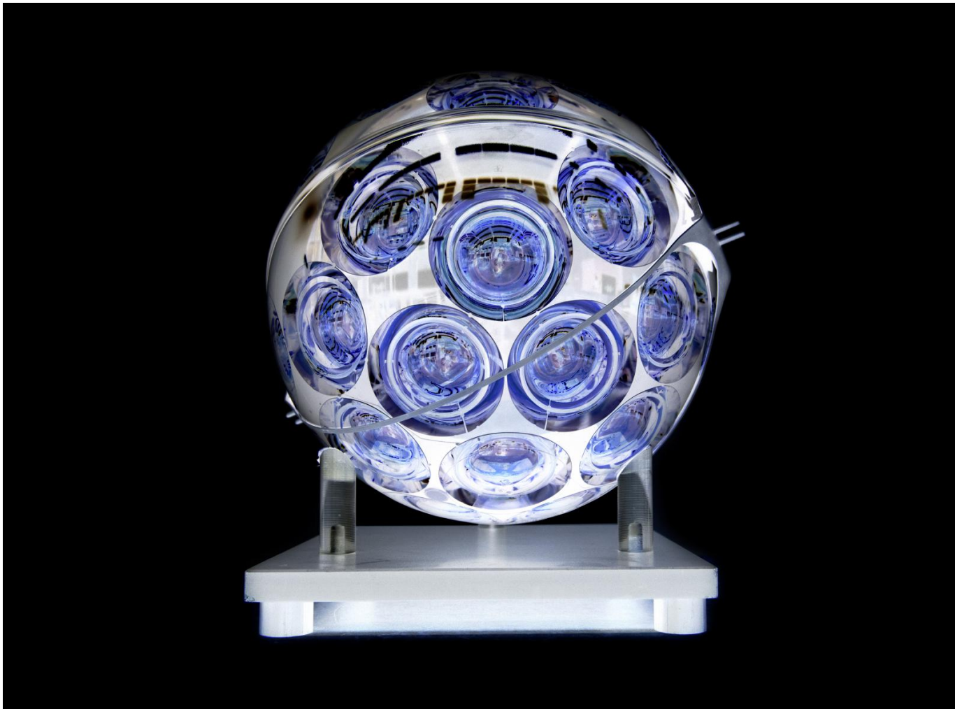
Afbeelding 1. Een “Digital Optical Module,” onderdeel van de neutrinedetector KM3NeT (kort voor “kubieke kilometer-neutrino telescoop”). Deze modules zijn onder andere ontwikkeld op het Nikhef.

Deel twee van het boek begint met astrofysisch onderzoek (afbeelding 2), maar gaat van daaruit snel naar de nanoschaal met nanofotonica en zonnecellen die efficiënter gemaakt worden met nanostructuren. Hierna laat Jansen iets zien van mechanische metamaterialen en zachte robotica, met ten slotte een reeks foto's van een meetopstelling in een van de laboratoria van de UvA, waar de elektronische eigenschappen van materialen met quantummechanische eigenschappen gemeten worden. Leuk en herkenbaar voor de auteur van dit artikel: ik mocht in het verleden met dezelfde opstelling werken.