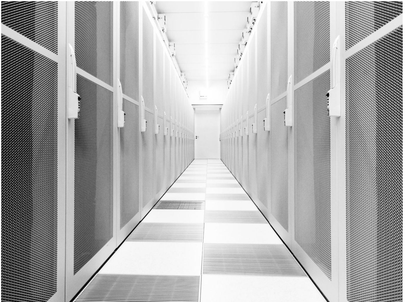
Afbeelding 4. 'Cartesius,' de nationale Nederlandse supercomputer, die wordt gebruikt voor ingewikkelde berekeningen en het verwerken van grote datasets.

vaker gebruikt wordt door ecologen, wordt ook getoond, evenals het gebruik van machine learning om 'space weather' zoals zonnevlammen te voorspellen.