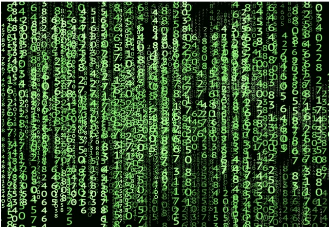
Afbeelding 1. The Matrix? Wat is een matrix nu eigenlijk echt, en wat heb je eraan?

Het is twintig jaar geleden dat de eerste Matrix-film uitkwam in de bioscoop. Om die reden is een gerestaureerde versie van de sciencefictionfilm, waarin mensen gevangen zitten in een computersimulatie, sinds eind vorige maand weer in bioscopen te zien. De film spreekt nog steeds tot de verbeelding - er is zelfs aangekondigd dat een vierde in de maak is - maar vanuit een natuurkundig oogpunt is de naam 'de matrix' op zijn minst opmerkelijk te noemen.