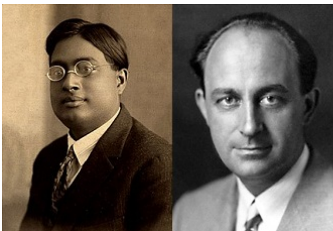
Afbeelding 2. Bose en Fermi. Satyendra Nath Bose (1894-1974) en Enrico Fermi (1901-1954).

Het zijn de fermionen die door de krachten die door bosonen worden overgebracht tot elkaar aangetrokken of door elkaar afgestoten worden en op die manier de basis vormen voor al de aan ons bekende materie. Je kunt zeggen dat fermionen veel individualistischer zijn dan de bosonische kuddedieren. Fermionen kunnen fundamenteel niet in eenzelfde toestand zitten, wat in de natuurkunde ook wel bekend staat als het uitsluitingsprincipe van Pauli . Deze definiërende eigenschap heeft onder andere tot gevolg dat de elementen in het periodiek systeem allemaal wonderlijk verschillende eigenschappen hebben. Dat zit zo: omdat de fermionen niet in eenzelfde toestand mogen zitten, moeten zij zich in steeds ingewikkeldere bochten wringen om toch allemaal in een atoom te passen. De wetenschappelijke benaming voor deze 'bochten' is elektronenschillen . Je kunt je die voorstellen als steeds ingewikkeldere geometrische banen die rond de atoomkern zijn opgebouwd.