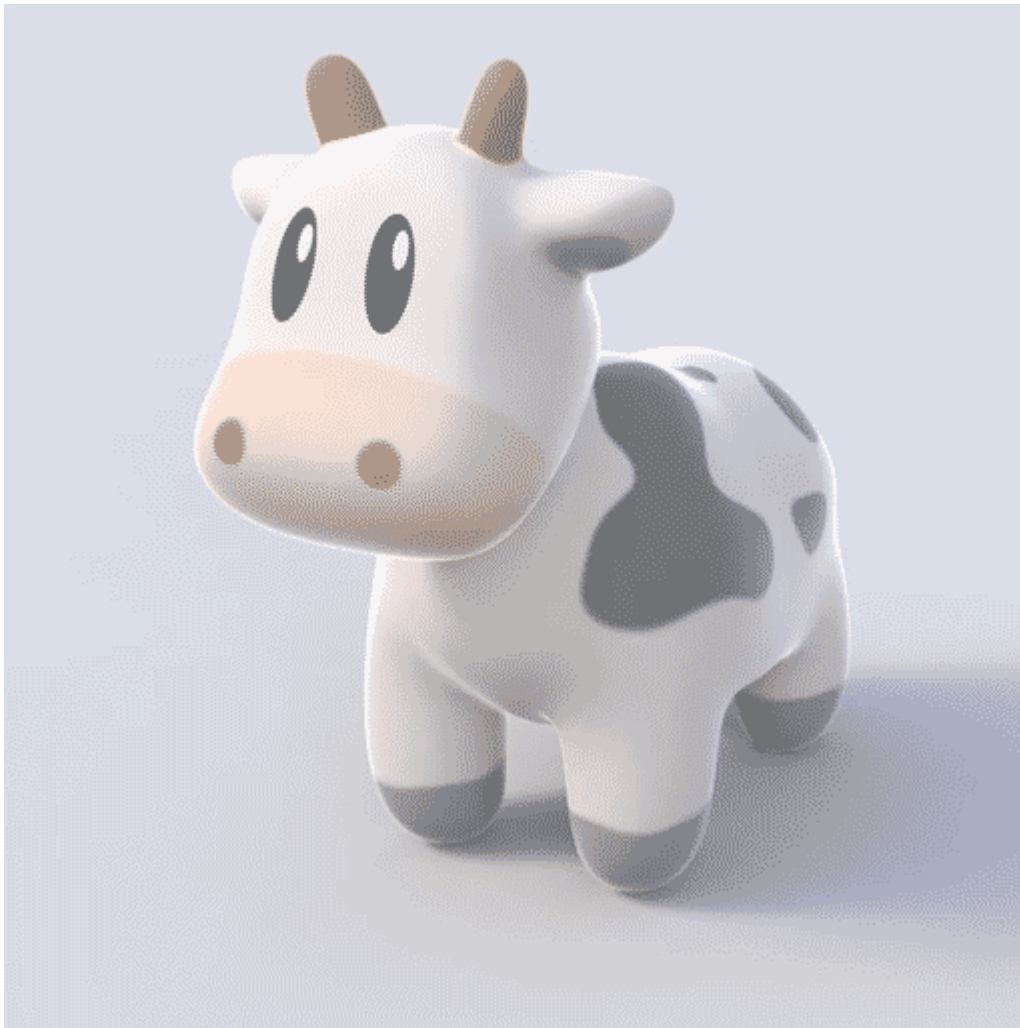
Afbeelding 4. Een bolvormige koe. Een bolvormige koe is minder realistisch dan een echte, maar eraan rekenen is wel veel eenvoudiger!

Een laatste en meer algemene motivatie is het zogenaamde “ bolvormige koe -principe”, dat ik als volgt kan uitleggen. Theoretisch natuurkundigen houden ervan om problemen exact op te lossen in plaats van een benadering te maken, omdat een exacte oplossing nu eenmaal meer inzicht biedt. Dit is typisch alleen mogelijk als de ingrediënten in het probleem simpel genoeg zijn. De aanwezigheid van een hoge mate van symmetrie levert vaak zo’n simplificatie op. Het blijkt dat supersymmetrie een symmetrie is die veel meer exacte berekeningen toestaat dan wanneer er geen supersymmetrie in het probleem aanwezig is. De truc is dan om een supersymmetrisch model te bouwen dat zoveel mogelijk op zijn minder symmetrisch maar meer realistische neefje lijkt, zoals een bolvormige koe op een koe kan lijken, maar qua rekenwerk (bijvoorbeeld om zijn inhoud te bepalen) een stuk eenvoudiger is. De hoop is dat sommige aspecten van de analyse in het meer symmetrische model ook