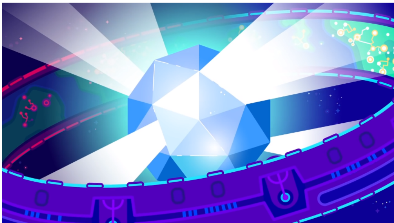
Afbeelding 1. Een zwartgatbom.

Onderzoek naar radicale gevolgen van Einsteins algemene relativiteitstheorie spreekt enorm tot de verbeelding. In het bijzonder zijn zwarte gaten een voorspelling die steeds meer verrassingen achter de hand heeft; de een nog fantastischer dan de ander. Dat we dergelijke singulariteiten in de ruimtetijd kunnen onderzoeken is op zich al bijzonder, maar elke wetenschapper weet natuurlijk dat de belangrijkste vraag om te stellen is: hoe laat ik dit ontploffen? Het antwoord luidt: aan de hand van superradiantie. Wat dat is? We leggen het even uit, maar zijn niet verantwoordelijk voor de gevolgen.