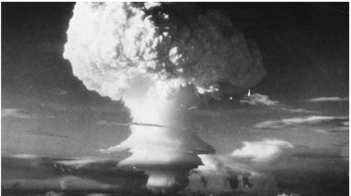
Afbeelding 4. Een waterstofbom. Het resultaat van het krachtigste massavernietigingswapen dat de aarde

De volgende stap is snel gemaakt: wat nu, als aan de ontsnapte golf niet wordt toegestaan weer de veilige interstellaire ruimte op te zoeken? Wat als die versterkte golf meteen terug de ergosfeer kan worden ingejaagd, en zo steeds meer van de rotatie van het zwart gat consumeert? Vergelijkbaar met de exponentiële versterking in de nucleaire reactie van een kernbom, zou dit al gauw leiden tot een opstapeling van een enorme energie. Een energie die na een tijd niet meer houdbaar is en met de explosieve kracht van een supernova het universum in wordt gejaagd. Een futuristische samenleving die in staat is een bolvormige spiegel rond een zwart gat te bouwen (zoals in afbeelding 1), zou op die manier een bom kunnen bouwen waarvan huidige dictatoren en criminelen gelukkig alleen maar kunnen dromen.