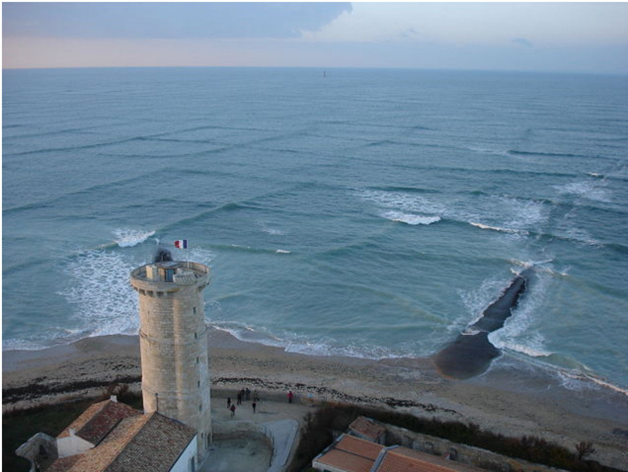
Afbeelding 4. Solitonen in ondiep water.

Overigens kan de parameter x ook bijvoorbeeld de tijd zijn. In dat geval moeten we een verschijnsel als hierboven letterlijk zien als iets wat we niet kunnen zien aankomen: op tijdstippen voor x=0 is de functie onveranderlijk, waarna er plotseling – instantaan – een bepaalde fluctuatie optreedt. In dit geval wordt een dergelijk verschijnsel ook wel een instanton genoemd.