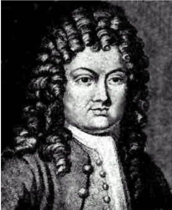
Afbeelding 2. Brook Taylor. De Engelse wiskundige Brook Taylor (1685-1731).

loslaten. Stel dat we bovendien de uitkomst van het probleem – de tijd die het proces duurt, de energie die erbij vrijkomt, of de temperatuur die ervoor nodig is – als functie van de parameter x , al exact kennen. Laten we die uitkomst schrijven als f(x) . Kunnen we dan ook een storingsreeks vinden, natuurlijk ook afhankelijk van x , die die uitkomst beschrijft?