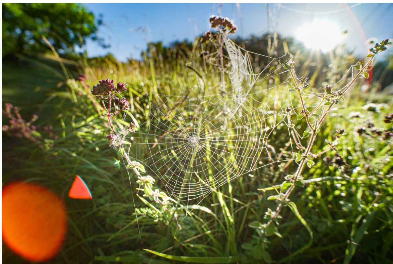
Afbeelding 1: Een spinnenweb in de natuur.

Spinnen - het zijn vrij controversiële dieren. Sommige mensen vinden ze geweldig, maar velen vinden spinnen juist eng of vervelend. We verwensen spinnen vooral in de herfst, als hun webben laag over de fietspaden hangen en we erin terechtkomen. Ook al lopen we er soms letterlijk recht tegenaan, veel mensen beseffen zich niet hoe bijzonder dat spinnenweb, en het spinrag waar het van gemaakt is, zijn.