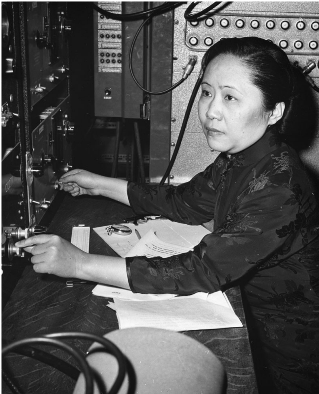
Afbeelding 3. Madame Wu.Chien-Shiung Wu in haar laboratorium. Foto via scientificwomen.net .

vervalsmogelijkheden zijn. De precieze mixing tussen de quarks kan op een meetkundige manier beschreven worden door drie hoeken, \theta_{12} , \theta_{23} en \theta_{13} , en één complex getal, e^{i\delta_{13}} . Het meten en berekenen van de hoeken en het complexe getal is een van de belangrijkste doelen in flavour physics. De complexe fase \delta_{13} speelt een belangrijke rol: de waarde van die variabele zorgt voor een fenomeen dat CP-schending wordt genoemd. Die CP-schending leidt er weer toe dat materie zich anders gedraagt dan anti-materie, en kan dus een licht werpen op een van de grote vragen waar we dit artikel mee begonnen!