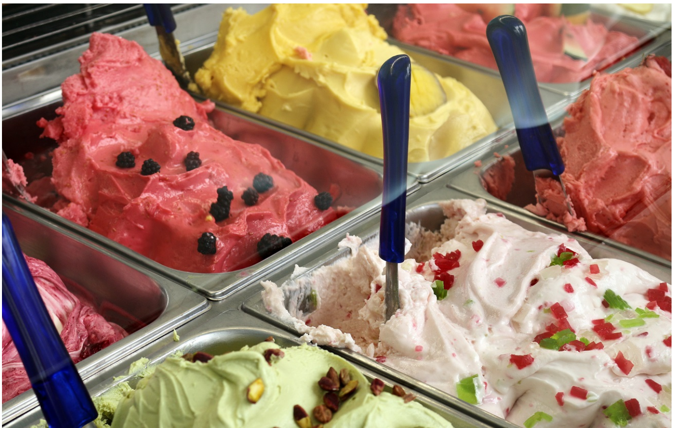
Afbeelding 1. Smaken verschillen. Hoeveel ‘smaken’ elementaire deeltjes zijn er?

Elementaire deeltjes hebben een eigenschap die ‘flavour’ wordt genoemd - smaak, dus. Gastauteur Philine van Vliet legt uit wat flavour precies is, en hoe die eigenschap ons iets kan leren over de kleine hoeveelheid antimaterie in het heelal.