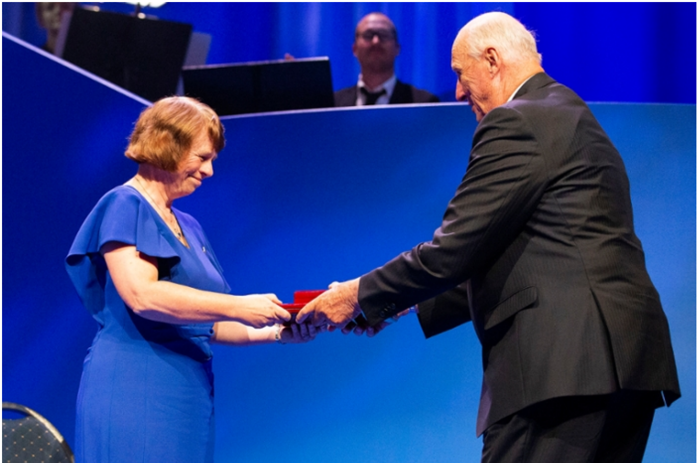
Afbeelding 3. De Kavli-prijs. Ewine van Dishoeck ontvangt de Kavli-prijs uit handen van de Noorse koning Harald.

bestudeerd, maar ook allerlei processen en reacties die die moleculen ondergaan. Een van de vooraanstaande wetenschappers op dit gebied is de Nederlandse Ewine van Dishoeck. Van Dishoeck, opgeleid als quantum-scheikundige, begon rond 1980 als promovendus in Leiden de astrochemie te bestuderen. In de jaren die volgden leverde ze talloze bijdragen aan het vakgebied: ze bracht aan de hand van waarnemingen met aardse en ruimtetelescopen de samenstelling van moleculaire gaswolken in kaart, en deed ook theoretische berekeningen aan de processen die zich in zulke gaswolken afspelen. Juist in die combinatie van theorie en waarneming ligt haar kracht: door eerst te berekenen wat je kunt verwachten, wordt het ontdekken van nieuwe moleculen in het heelal en de reacties die die moleculen ondergaan eenvoudiger.