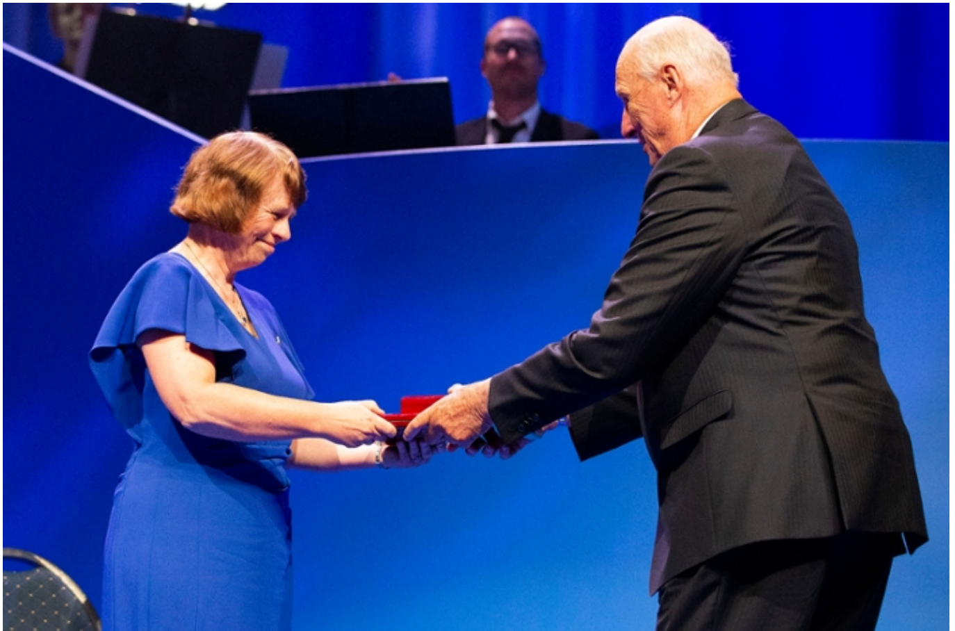
Afbeelding 3. De Kavli-prijs. Ewine van Dishoeck ontvangt de Kavli-prijs uit handen van de Noorse koning Harald.

bestudeerd, maar ook allerlei processen en reacties die die moleculen ondergaan. Een van de vooraanstaande wetenschappers op dit gebied is de Nederlandse Ewine van Dishoeck. Van Dishoeck, opgeleid als quantum-scheikundige, begon rond 1980 als promovendus in Leiden de astrochemie te bestuderen. In de jaren die volgden leverde ze talloze bijdragen aan het vakgebied: ze bracht aan de hand van waarnemingen met aardse en ruimtetelescopen de samenstelling van moleculaire gaswolken in kaart, en deed ook theoretische berekeningen aan de processen die zich in zulke gaswolken afspelen. Juist in die combinatie van theorie en waarneming ligt haar kracht: door eerst te berekenen wat je kunt verwachten, wordt het ontdekken van nieuwe moleculen in het heelal en de reacties die die moleculen ondergaan eenvoudiger.