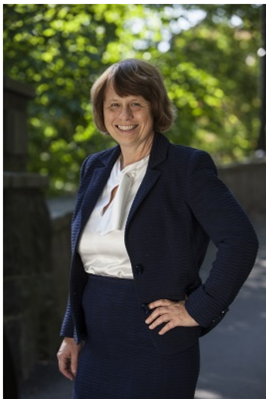
Afbeelding 1. Ewine van Dishoeck.

Dat er op aarde en in sterren allerlei scheikundige processen plaatsvinden weten we, maar is er ook scheikunde tússten de sterren, in de ijle gaswolken die zich daar bevinden? Het antwoord is “ja” - er is zelfs een heel vakgebied gewijd aan zulke interstellaire moleculen en de reacties die ze ondergaan: de astrochemie. De Nederlandse Ewine van Dishoeck is een van de belangrijkste onderzoekers in dit vakgebied. Deze week kreeg ze voor haar werk de Kavli-prijs, de “Noorse Nobelprijs”, met een bijbehorend geldbedrag van maar liefst een miljoen euro.