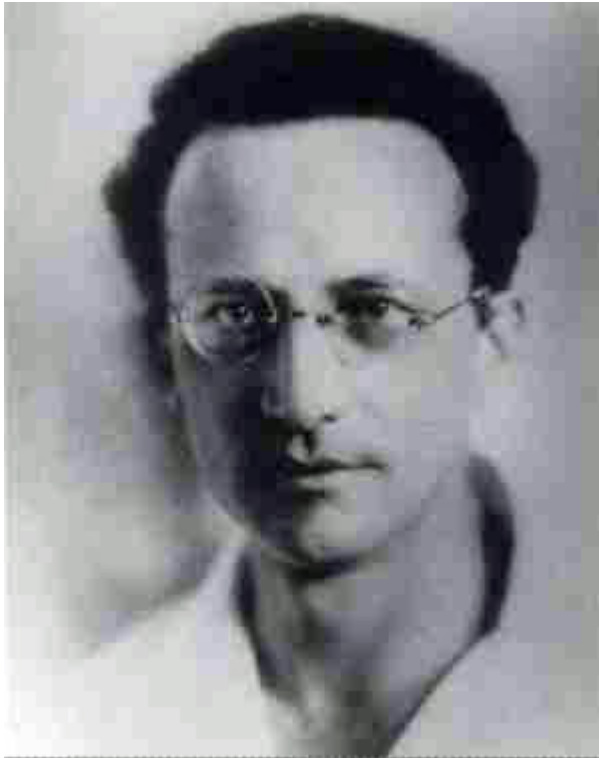
Afbeelding 3. Erwin Schrödinger.

Voor wie niet schrikt van een wiskundige vergelijking: in de meest eenvoudige formulering ziet de vergelijking van Schrödinger er als volgt uit: