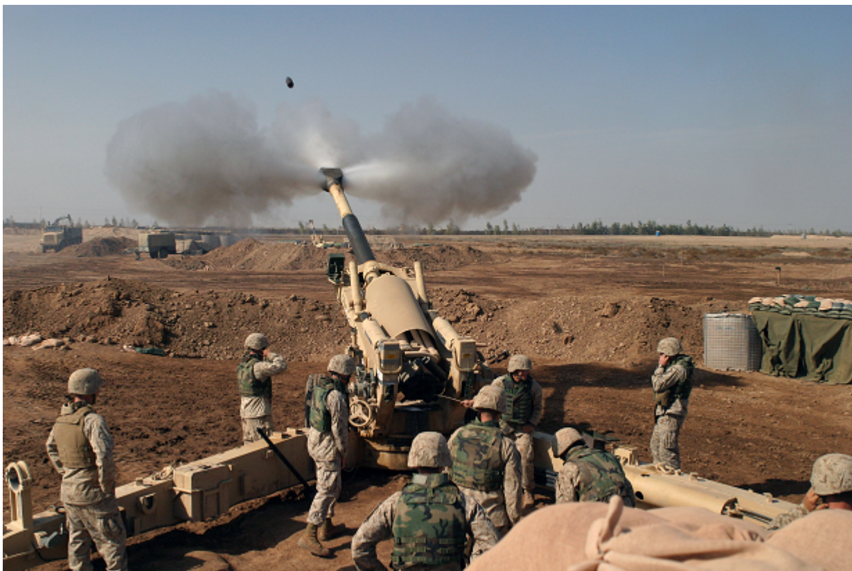
Afbeelding 2. Een kanonskogel. Om de dynamica van een kanonskogel te kunnen beschrijven, zijn we met name geïnteresseerd in hoe zijn plaats x en snelheid v in de loop van de tijd t veranderen.

Het belangrijkste verschil tussen rekenen aan een klassiek systeem en rekenen aan een quantumstelsel is het volgende. Een klassiek systeem kan volledig beschreven worden door van al zijn relevante eigenschappen te beschrijven hoe die in de loop van de tijd veranderen. Als we bijvoorbeeld de baan van een kogel willen beschrijven, zijn we in het algemeen geïnteresseerd in de positie ( x ) en de snelheid ( v ) van die kogel. Die positie en snelheid veranderen in de loop van de tijd, dus de dynamica van het systeem kan beschreven worden door een tweetal functies, x(t) en v(t) .