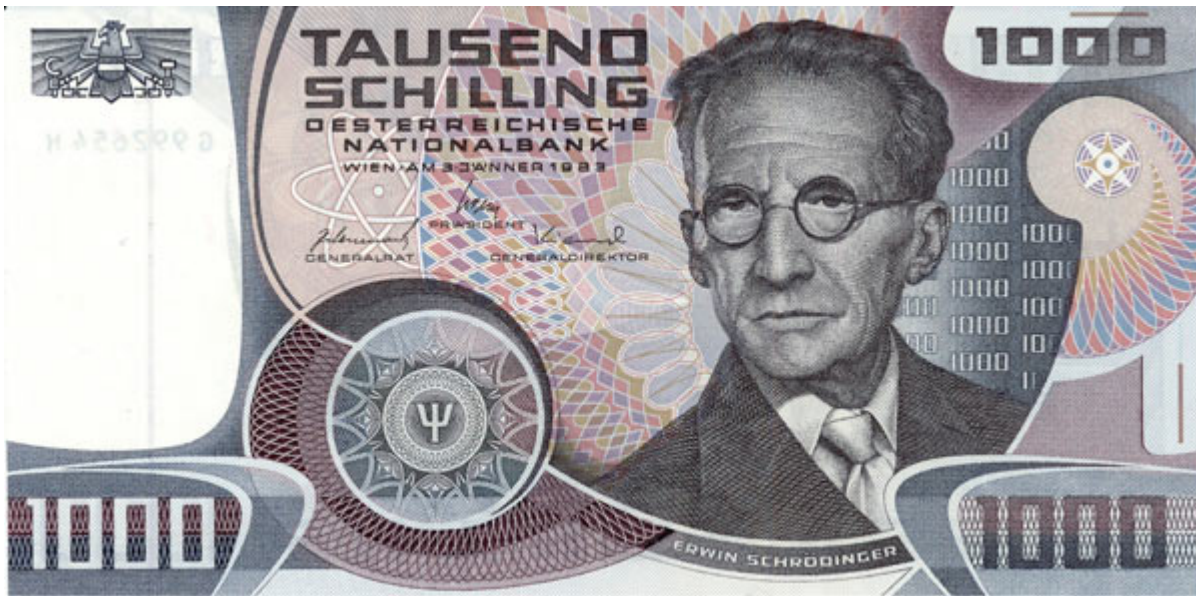
Afbeelding 5. Erwin Schrödinger. Erwin Schrödinger - en het symbool \Psi voor de golf functie - op een Oostenrijks bankbiljet van 1000 schilling.

Tenslotte zien we rechts in de vergelijking het symbool \hat{H} staan. Het hoedje op de H geeft aan dat het gaat om een zogenaamde operator : \hat{H} is geen getal, maar een voorschrift dat ons vertelt hoe we uit de \Psi op dit moment, de toekomstige \Psi kunnen uitrekenen. De notatie \hat{H} is een geval van extreme “shorthand” - in de praktijk is het namelijk zo dat deze \hat{H} er voor ieder verschillend probleem anders uit zal zien. De ene keer is het genoeg om bijvoorbeeld \Psi te kwadrateren, de andere keer moeten we ook aan de rechterkant van \Psi bepaalde afgeleiden nemen, enzovoort. Kortom: de echte fysica zit hem in de precieze vorm van de operator \hat{H} . Wat Schrödinger deed was uitvogelen hoe deze operator er voor elk fysisch systeem uitziet - dat wil zeggen: hij gaf een exact voorschrift om, als we de klassieke bewegingswetten van een systeem kennen, ook de quantumoperator \hat{H} uit te rekenen. Daarmee kon vanaf dat moment voor vrijwel elk systeem de quantum-evolutie bepaald worden. Zo konden dus voorspellingen aan quantumsystemen gedaan worden - voorspellingen die natuurlijk vervolgens weer in experimenten getest konden worden. De afleiding van de Schrödingervergelijking was dan ook een zeer belangrijke doorbraak in de ontwikkeling van de quantummechanica.