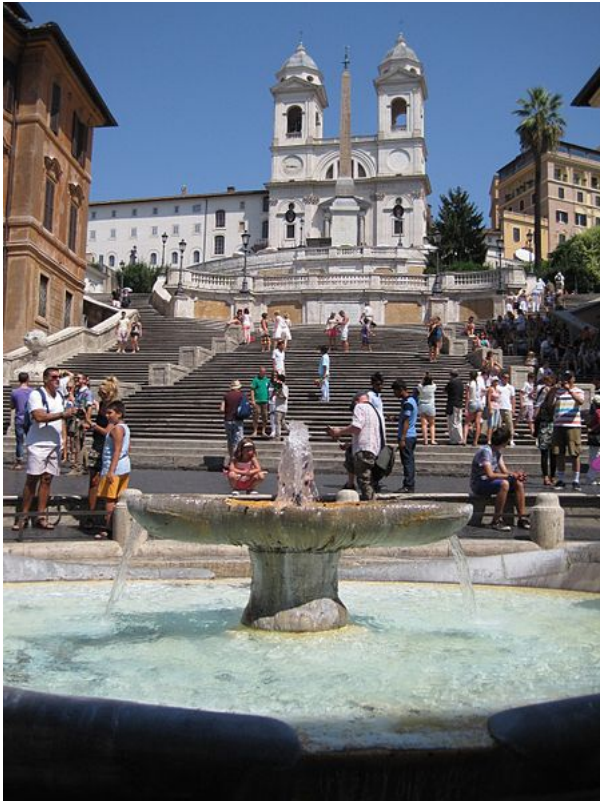
Afbeelding 2. De Spaanse Trappen. Op bijvoorbeeld een ladder kan op elke tree normaalgesproken maar één persoon staan. Op sommige trappen, zoals hier, kunnen echter heel veel personen tegelijk op dezelfde tree staan.

Kortom: om de vraag goed te formuleren, moeten we aangeven of twee personen op dezelfde tree kunnen staan. Iets meer natuurkundig geformuleerd: we moeten aangeven of twee personen zich in dezelfde toestand kunnen bevinden.