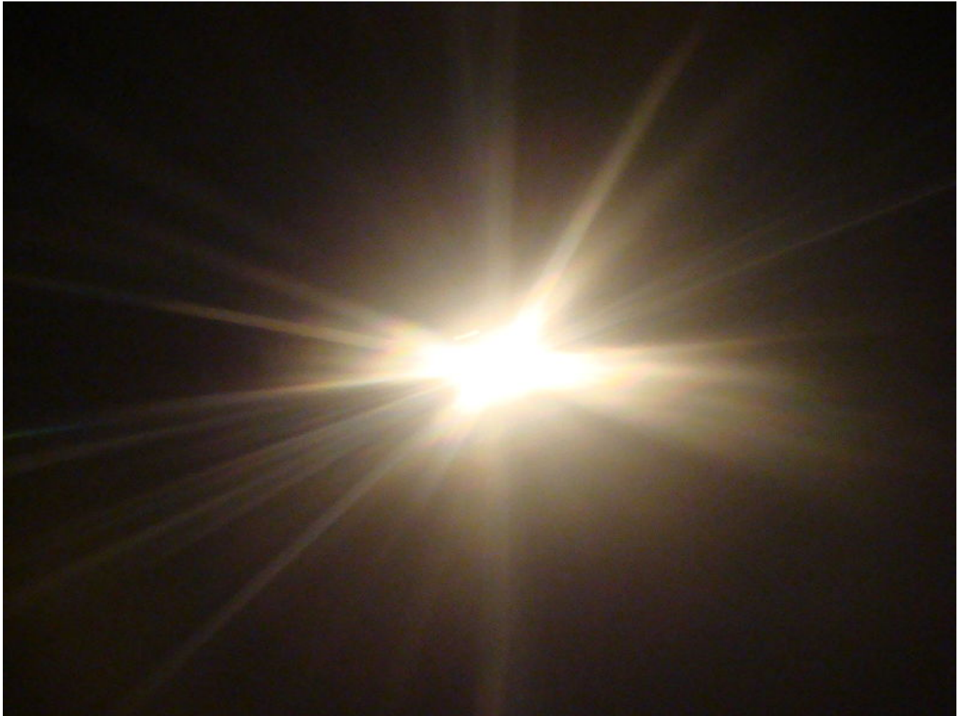
Afbeelding 1. Licht. Kunnen we lichtdeeltjes laten condenseren? Afbeelding: Zouavman Le Zouave.