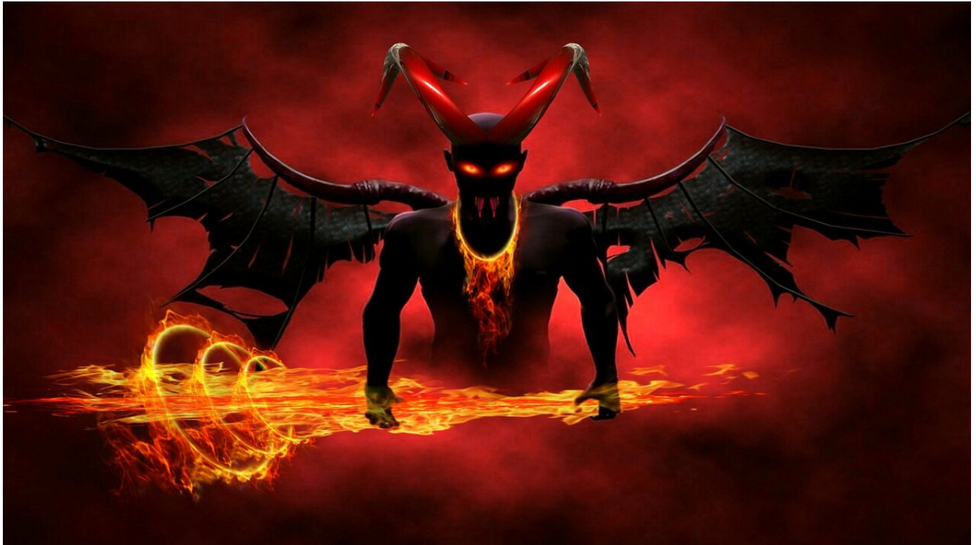
Flames Devil Horror Horns Demon