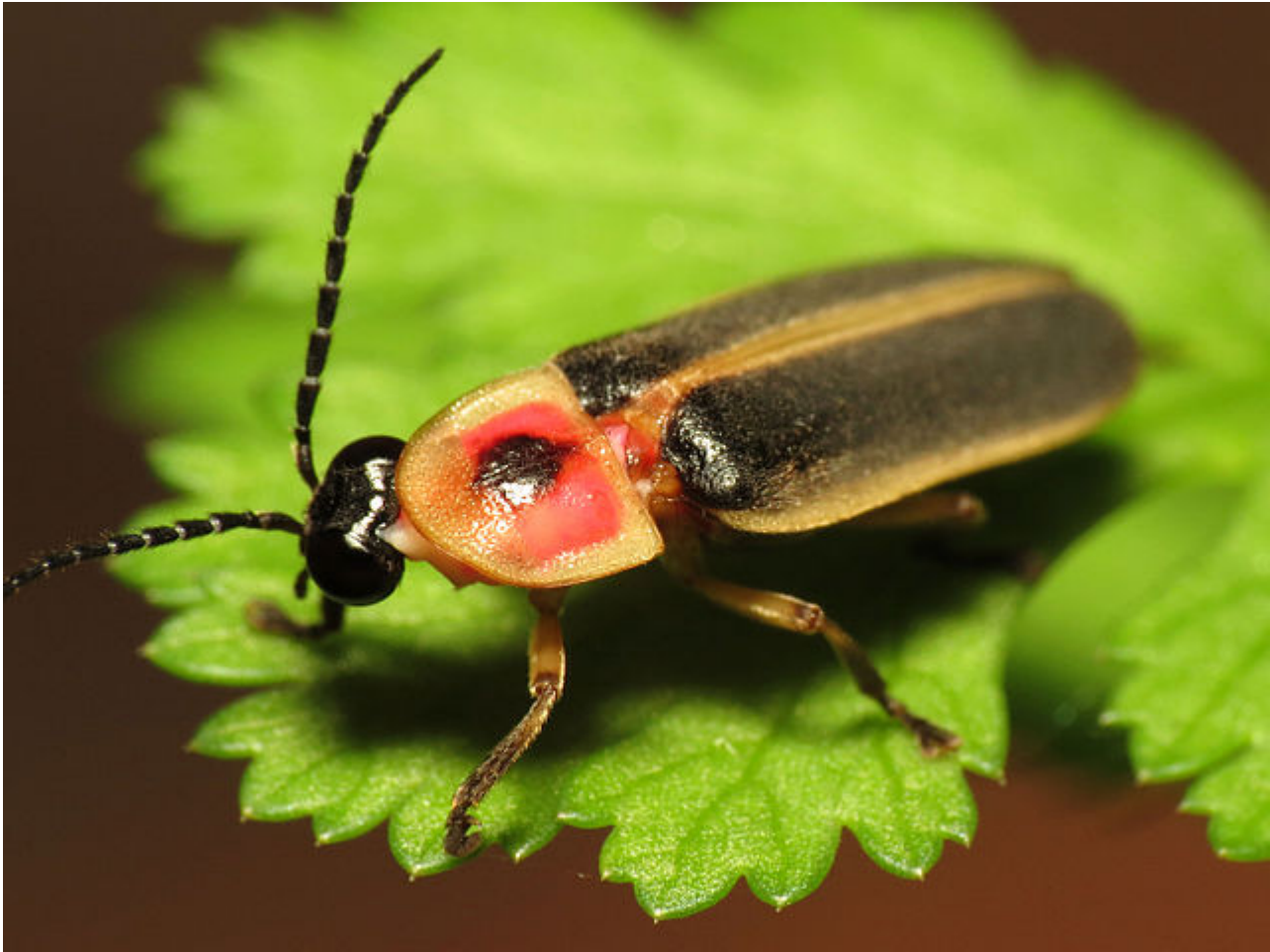
Afbeelding 3. Photinus pyralis, een vuurvliegje. Foto: Katja Schulz .

Een prachtig soort synchronisatie is te zien bij vuurvliegjes. Met name in het zuidoosten van Azië zijn er bepaalde vuurvliegjes die 's nachts, in groten getale, hun knippen synchroniseren. Al in het begin van de twintigste eeuw probeerden mensen dit te verklaren, maar omdat dit veel te ingewikkeld gedrag leek voor zo'n eenvoudig beestje werd de verklaring vaak buiten de kever gezocht. Zo werd er bijvoorbeeld gezegd dat het juist de mensen waren die in het donker met hun ogen knipperden, of dat er windvlagen waren die over alle vuurvliegjes heen trokken en zo van buitenaf het synchroniseren afdwongen.