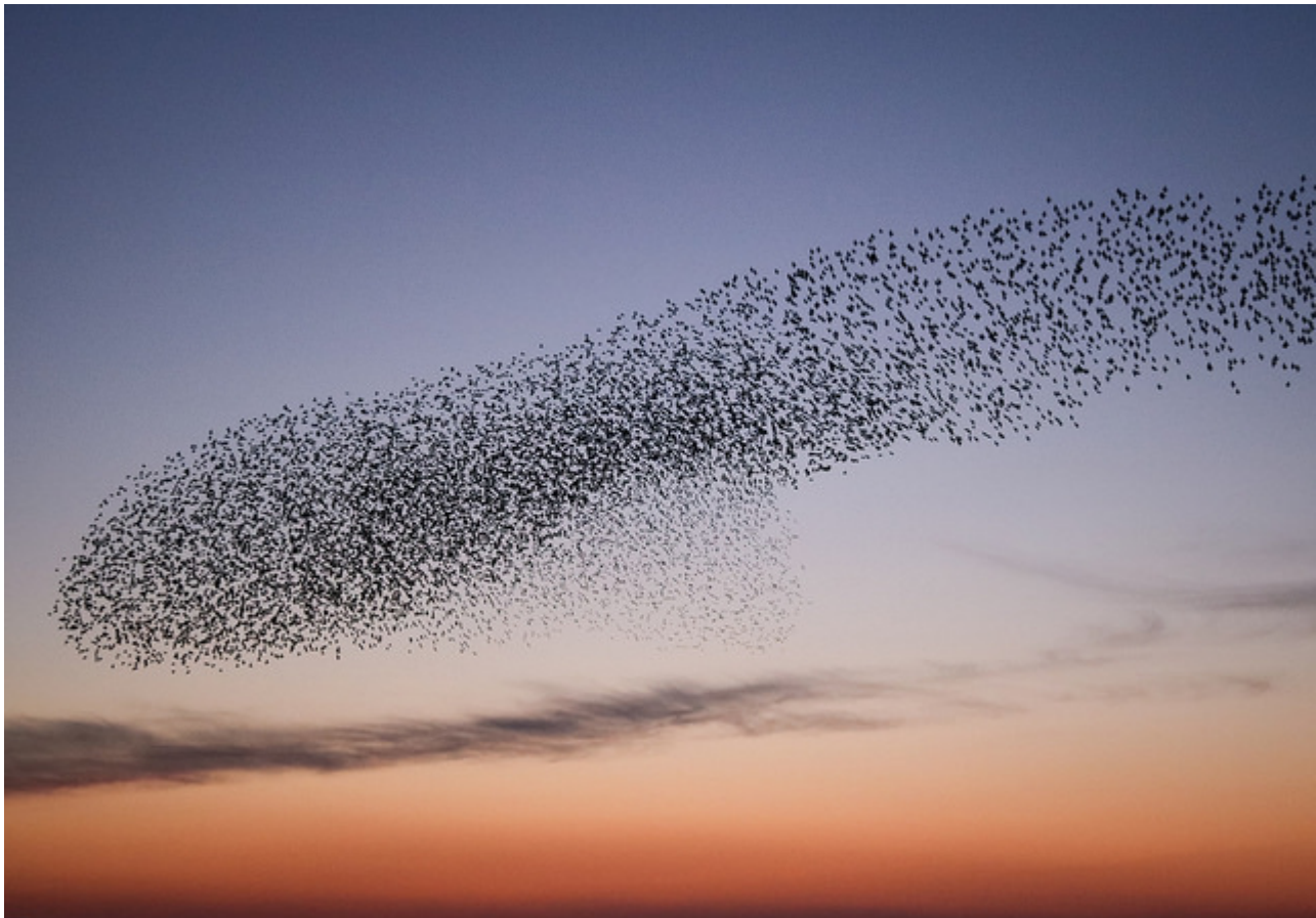
Afbeelding 2. Een zwerm spreeuwen.