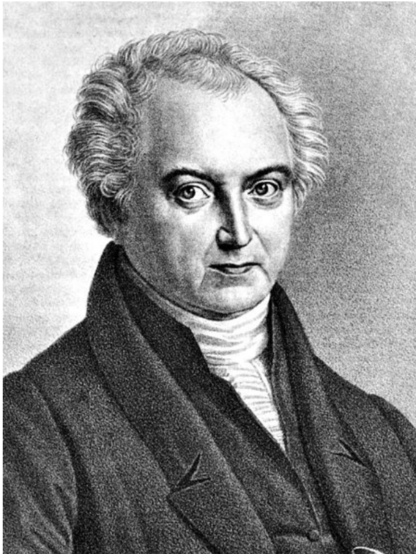
Afbeelding 1. Heinrich Wilhelm Olbers (1758-1840). Heinrich Olbers, naar wie de “dark night sky paradox” is vernoemd. Het probleem was echter al aan het begin van de zeventiende eeuw geformuleerd. Lithografie van Rudolph Suhrlandt.

Op die laatste vraag zijn verschillende antwoorden mogelijk, maar duidelijk is in elk geval dat je aannames over het heelal niet allemaal juist kunnen zijn. Dit probleem staat bekend als Olbers' paradox, naar de amateurastronoom Heinrich Wilhelm Olbers (overigens niet de eerste die hierover schreef). Laten we, voor we naar oplossingen van de paradox kijken, nog iets preciezer beargumenteren waarom het altijd licht zou moeten zijn in een statisch, oneindig oud heelal. We moeten immers ook rekening houden met het feit dat sterren die verder weg staan minder lichtopbrengst geven. Verdeel het heelal om je heen in gedachten in allemaal bolschillen van gelijke dikte, bijvoorbeeld één lichtjaar. Stel dat er in de schil tussen 1000 en 1001 lichtjaar van ons weg een miljoen sterren zitten. Het volume in de schil tussen 2000 en 2001 lichtjaar is vier keer zo groot en bevat dus (als de sterren homogeen verdeeld zijn over het heelal) vier miljoen sterren. Maar: de lichtkracht van een ster neemt kwadratisch af met de afstand, en is voor deze sterren dus vier keer zo klein. Beide effecten heffen elkaar precies op, dus uiteindelijk is de totale lichtopbrengst per schil gelijk. In een oneindig groot, oud heelal ontvangen wij licht van oneindig veel van die schillen, en dus zou