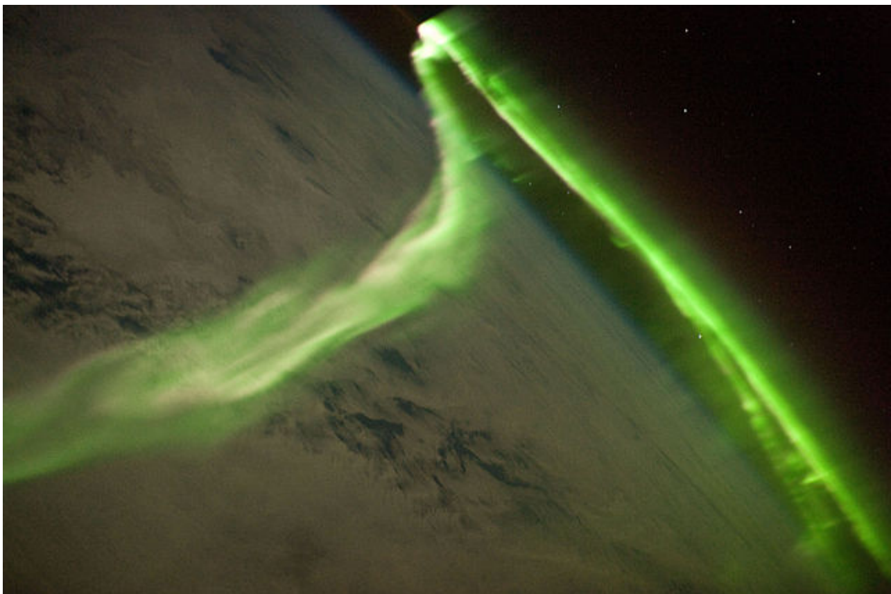
Afbeelding 1. Poollicht. Het poollicht (hier bij de zuidpool) gefotografeerd vanuit het ruimtestation ISS .

Noorderlicht is, ondanks dat we het in Nederland niet zo heel vaak kunnen zien, een bekend verschijnsel. Maar hoe wordt dit licht veroorzaakt, waaróm zien we het in Nederland zo weinig, en bestaat er ook een “zuiderlicht”? Watse Sybesma beantwoordt diverse vragen over het poollicht.