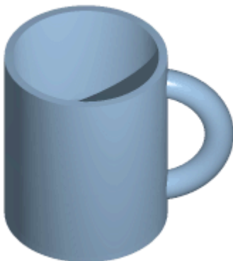
Afbeelding 1. Topologie. Een koffiekop en een donut zijn topologisch gezien precies hetzelfde object. Animatie: Lucas V. Barbosa.

Topologie is een tak van de wiskunde die zich bezighoudt met continue vervormingen. Iets preciezer: de centrale vraag in de topologie is welke eigenschappen van objecten niet veranderen als we het object continu (op een “vloeiende” manier) vervormen.