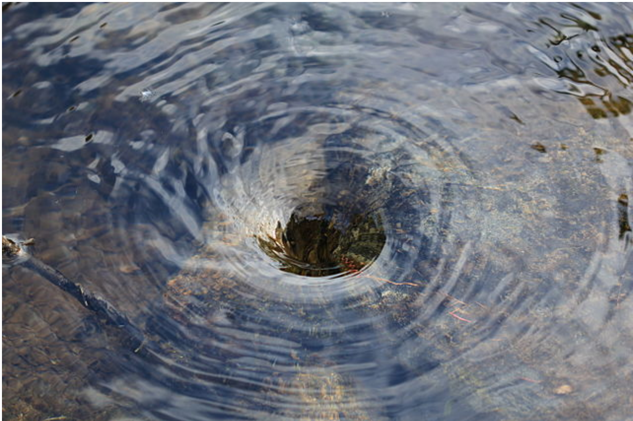
Afbeelding 3. Een draaikolk. Een wateroppervlak is een voorbeeld van een tweedimensionaal systeem. Als er in dit oppervlak een defect is, kan er een vortex ontstaan: een draaikolk. Afbeelding: Wikipedia-gebruiker Shutinc.

Juist in zulke lagerdimensionale systemen blijkt topologie vaak een interessante rol te spelen, en het zijn juist zulke systemen die Thouless, Haldane en Kosterlitz bestudeerd hebben.