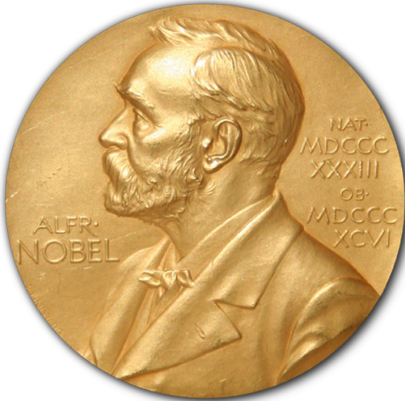
Afbeelding 5. De Nobelprijs. De medaille die alle Nobelprijswinnaars, naast natuurlijk een fors geldbedrag, ontvangen.

De studie naar topologische fases van materialen en de overgangen tussen die fases, begon zoals gezegd met theorie, en werd al snel ook een experimentele wetenschap. Ook de volgende stap wordt gezet: materialen waarin bijzondere fase-overgangen plaatsvinden, kennen allerlei potentiële technologische toepassingen – bijvoorbeeld voor het maken van schakelingen met bijzondere stroomgeleidingseigenschappen of het ontwikkelen van quantumcomputers. Kortom: de theorie van exotische materie leidt tot praktische toepassingen die steeds minder ‘exotisch’ worden – een ontdekking, dus, die de Nobelprijs meer dan waard is!