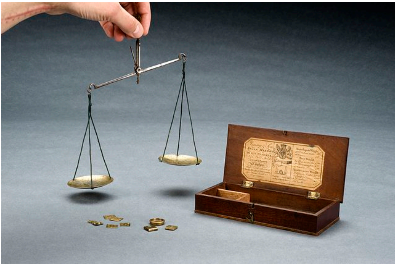
Afbeelding 1. Een weegschaal. Moeten natuurkundige ideeën altijd door middel van metingen getest kunnen worden?

De vraag in de titel van dit stukje lijkt op het eerste gezicht nogal vreemd. De output van natuurkundige theorieën komt immers meestal in de vorm van voorspellingen. Die voorspellingen stellen ons in staat om de betreffende theorie over de natuur experimenteel te testen. Is het dus niet voor de hand liggend dat natuurkunde altijd meetbaar moet zijn?