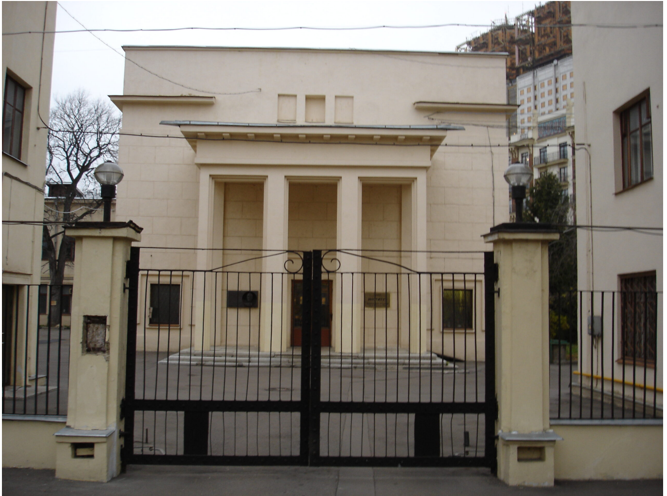
Afbeelding 3. Het Landau-instituut. Het instituut voor theoretische fysica in Moskou is – hoe kan het ook anders – vernoemd naar Lev Landau. Foto: Zac Allan .