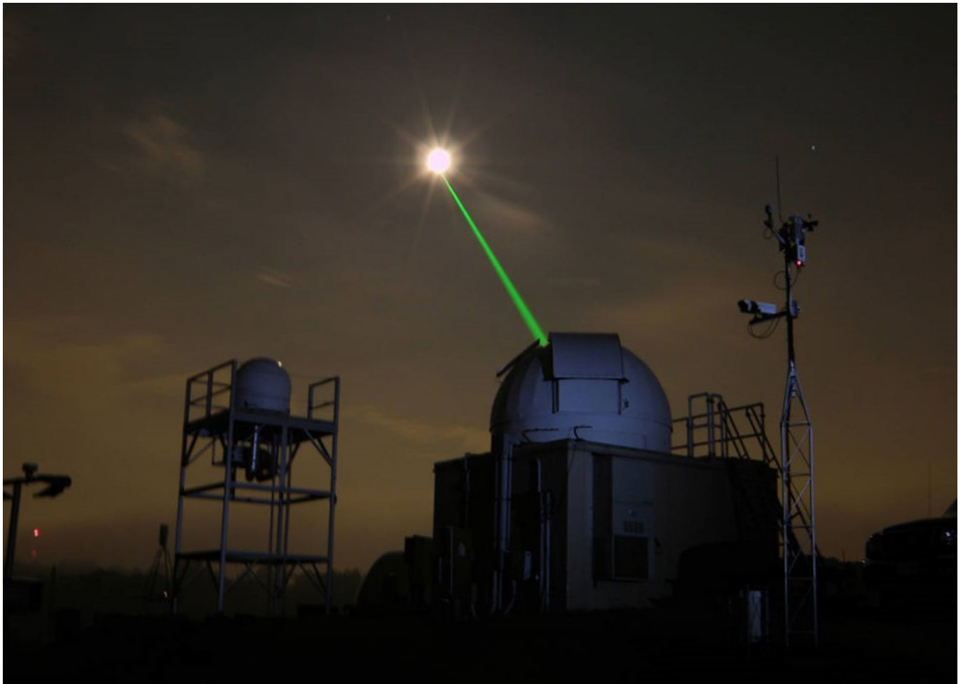
Afbeelding 2. Zo meten we de afstand naar de maan. De Laser Ranging Facility van het Goddard Space Flight Center richt een laser naar de maan.