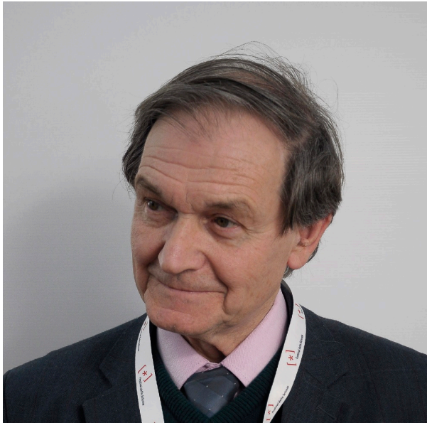
Afbeelding 2. Roger Penrose.