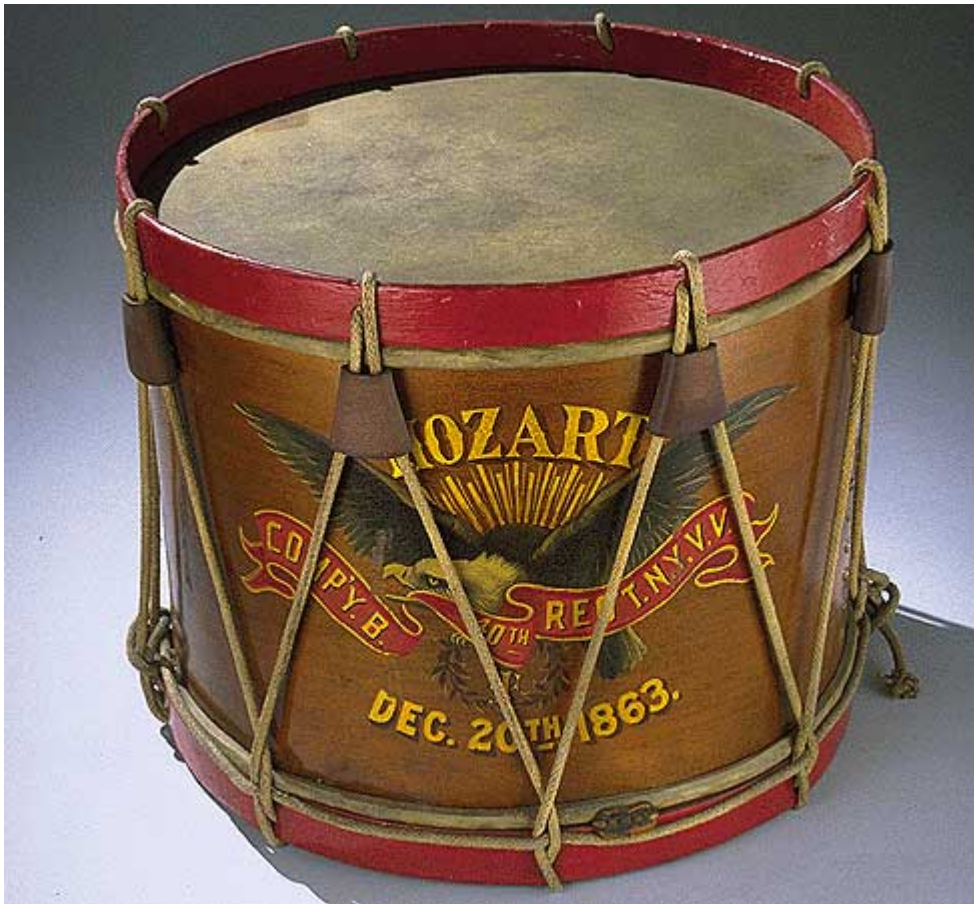
Afbeelding 3. Een trommel.

worden achterhaald. Dit kan je voor je zien als het luisteren naar het geluid op verschillende plekken langs de rand van de trommel.