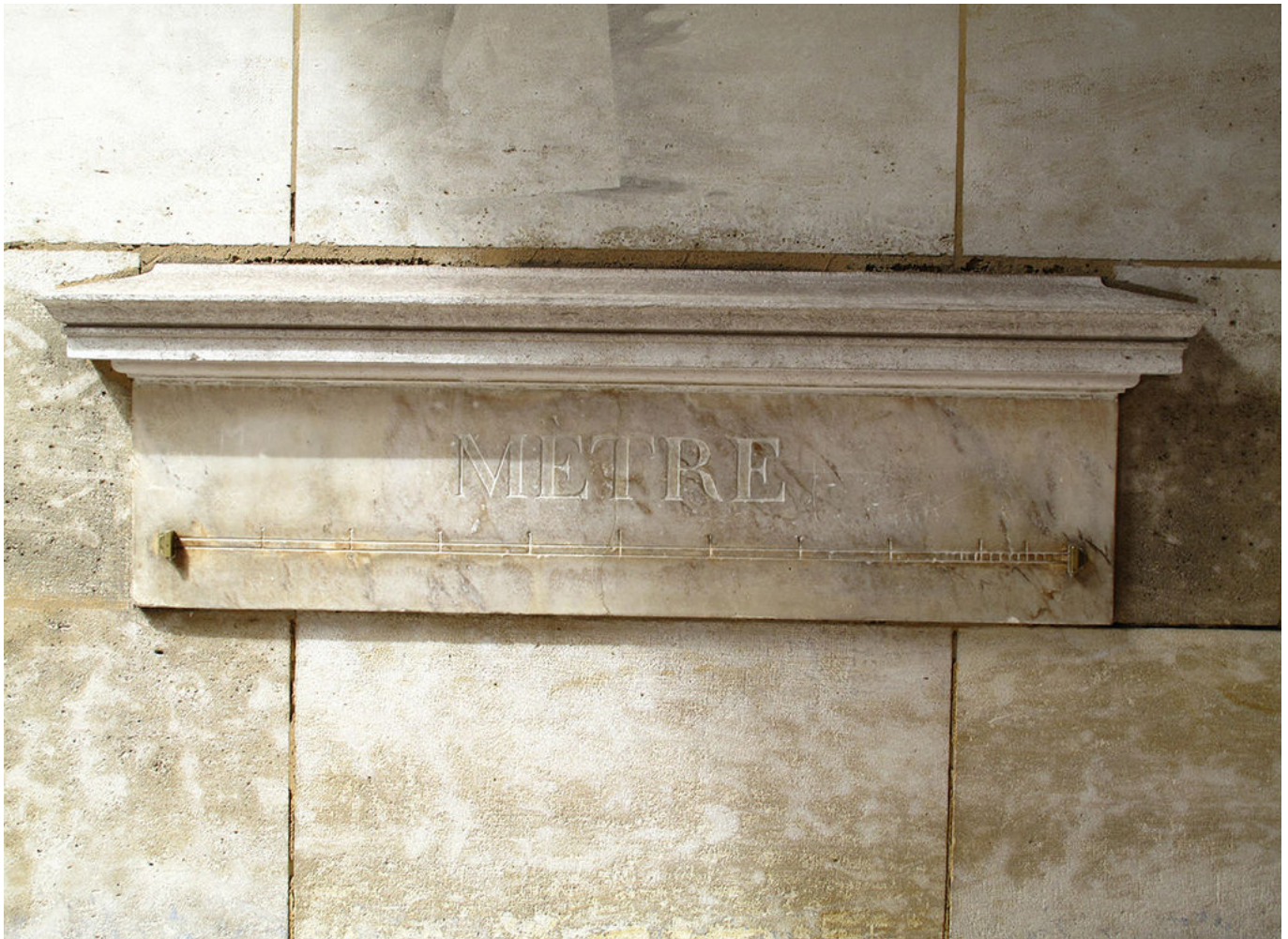
Afbeelding 1. Een kopie van de mètre étalon, tentoongesteld in Parijs.

Gedurende zo'n 130 jaar vormden de platina staaf, samen met kopieën van deze staaf, de standaarddefinitie van de meter. Heel handig was het niet. Bij een kopie was altijd een bepaalde onzekerheid over hoe precies zij was en bovendien waren er niet veel kopieën beschikbaar. Daarnaast is de precieze lengte van de staaf afhankelijk van de temperatuur. Een nieuwe definitie was gewenst.