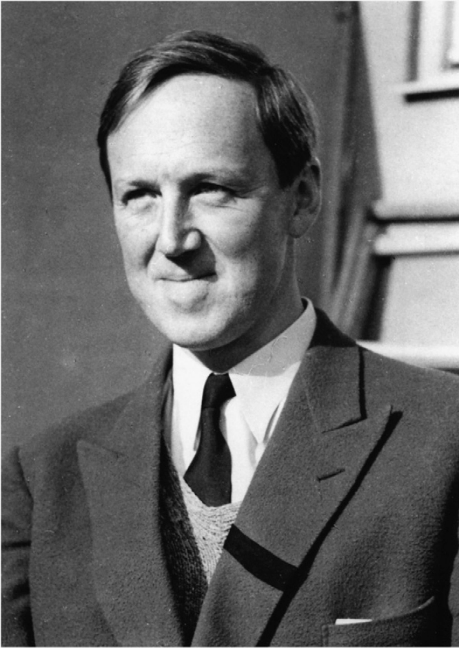
Afbeelding 1. Hannes Olof Gösta Alfvén (1908-1995).

Een foto van Alfvén uit 1942. Fotograaf onbekend.