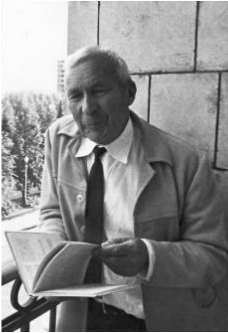
Afbeelding 2. Andrej Kolmogorov.

3. Snelheid (laat). Het Reynoldsgetal waar we in het vorige artikel over hadden kun je nu met deze informatie uitrekenen – althans: de afhankelijkheid van de tijd. Het resultaat blijkt te zijn dat dit getal afneemt in de tijd, en wel zodanig dat naarmate de tijd verstrijkt, viscositeit belangrijker wordt en er dus meer wrijving optreedt in de vloeistof. Dit heeft dan weer als gevolg dat de snelheid nóg sneller afneemt. Wederom kun je dan via dimensie-analyse laten zien dat de snelheid in het late stadium van turbulentie afneemt met de tijd als