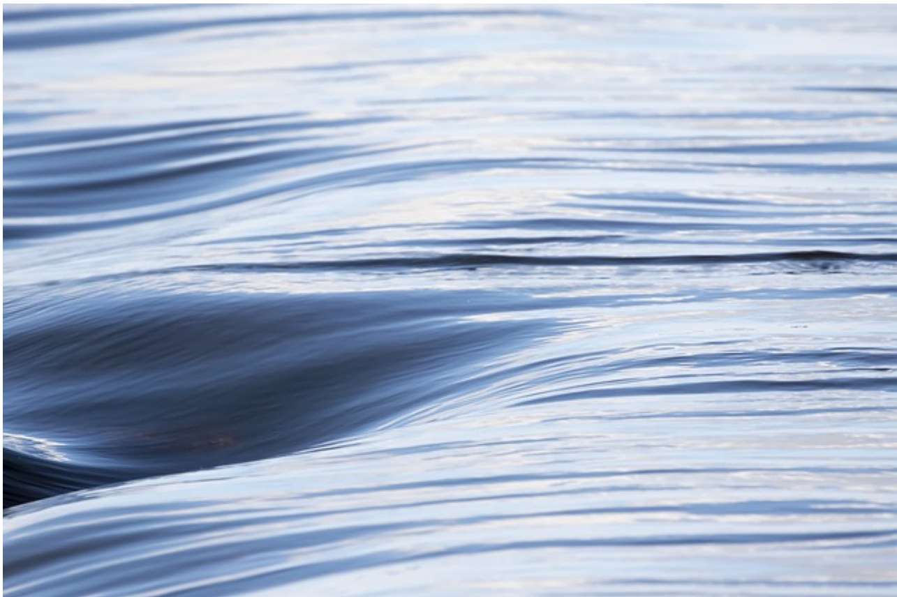
Afbeelding 1. Alles stroomt - maar hoe?

Vloeistoffen zijn overal. Niet alleen het water dat uit de kraan komt laat zich als vloeistof beschrijven, maar elektronen die door een geleider stromen, het quark-gluonplasma dat ontstaat in deeltjesversnellers en zelfs het uitdijend heelal kunnen, ondanks hun sterk verschillende microscopische aard, allemaal beschreven worden als vloeistof. Hoog tijd dus voor een QU-dossier over hydrodynamica, oftewel: vloeistofleer.