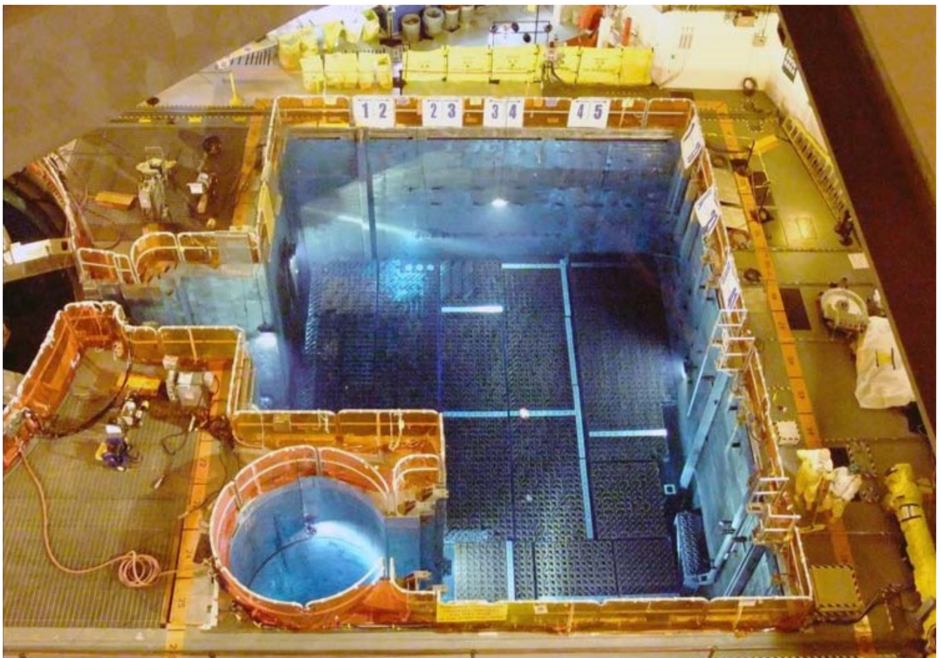
Afbeelding 2. Een spleitstofbassin Afbeelding: Nuclear Energy Institute, U.S. Government Accountability Office .

Kernreactoren gebruiken de warmte van radioactieve kernsplijting om energie op te wekken. Stiekem werken ze als stoommachines : met de hitte die vrijkomt van het radioactieve verval wordt stoom gemaakt, waarmee turbines worden aangedraaid . Als splijtstof gebruiken deze reactoren kleine, twee centimeter lange keramische uranium- of plutoniumdioxidekorrels die verzegeld zijn in metalen staven. Nadat het bruikbare uranium of plutonium in deze staven op is, zijn de staven nog steeds zeer radioactief. De verbruikte splijtstof is een hoogactieve afvalstof, met veel langlevende radioactieve isotopen die ook nog veel warmte uitstralen.