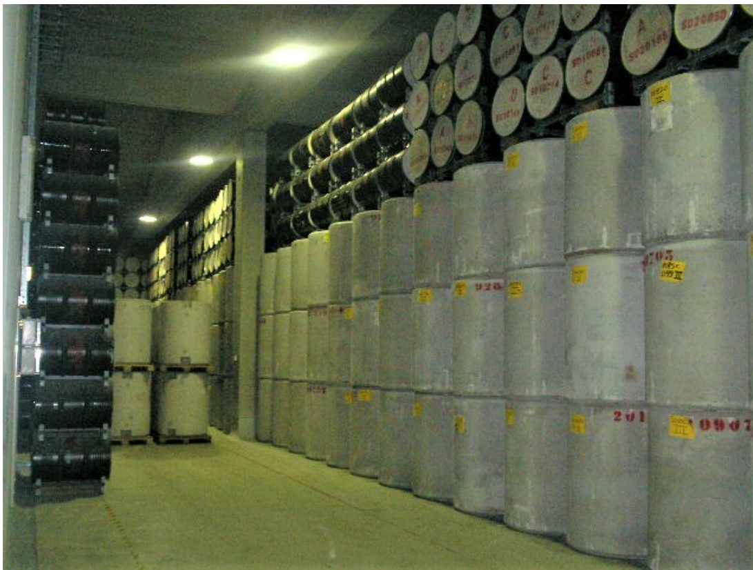
Afbeelding 5. Tonnen met nucleair afval. Deze dry casks staan in het Hoogradioactief Afval Behandelings- en Opslaggebouw (HABOG) van de Centrale Organisatie Voor Radioactief Afval (COVRA) te Nieuwdorp. Dit is de enige opslagplaats voor radioactief afval in Nederland .

Hier ligt het grote probleem: zulke dry casks blijven nog eeuwenlang radioactief, en moeten ergens opgeslagen worden waar ze al die tijd niet in aanraking kunnen komen met de biosfeer. Dit betekent dat de opslaglocatie bestendig moet zijn tegen onder andere aardbevingen, vulkaanuitbarstingen en terroristische aanvallen. Ook mag de radioactieve stof niet uit de casks gaan lekken en in het grondwater terechtkomen.