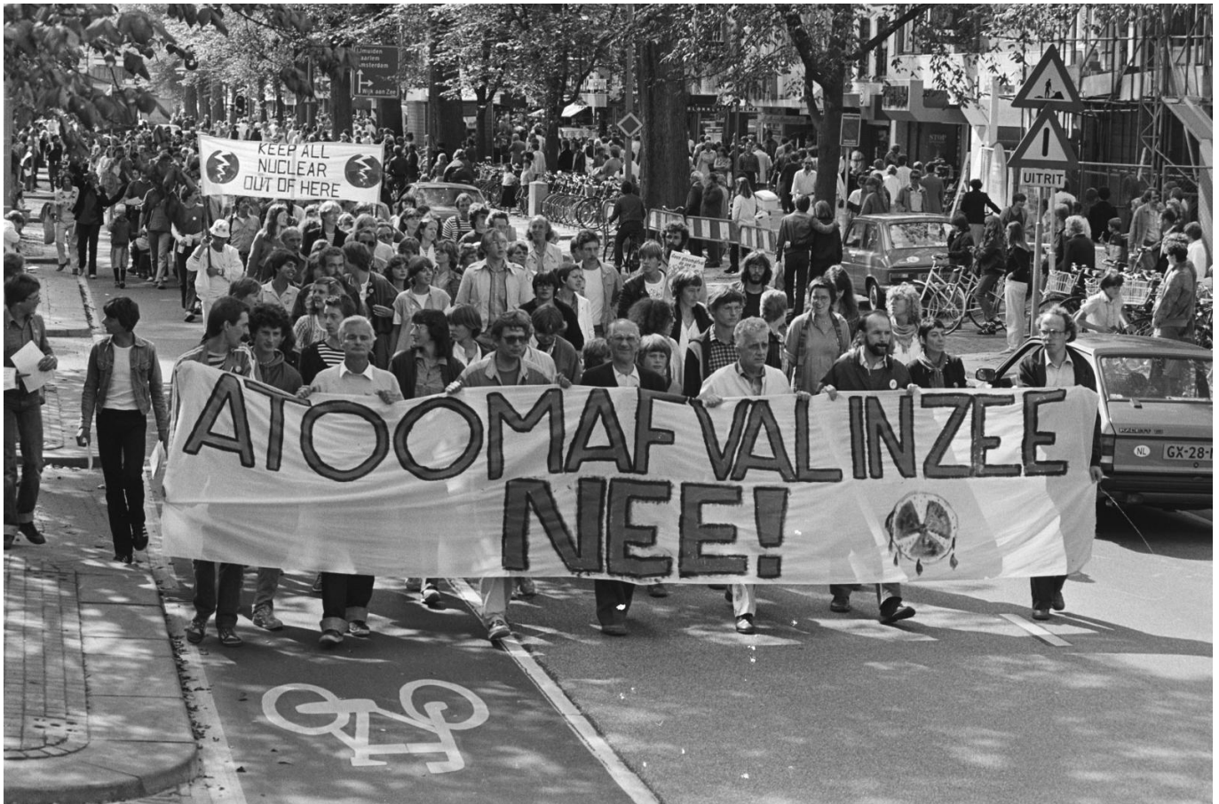
Afbeelding 6. Antikernafval demonstranten in Beverwijk, 1981.

Toch zijn er positieve ontwikkelingen gaande. Het is mogelijk om verbruikt nucleair afval te recyclen door het overgebleven uranium en plutonium uit de verbruikte splijtstof te extraheren, iets wat hopelijk steeds vaker gedaan zal worden. Ook zijn er al moderne reactoren ontworpen die juist het verbruikte splijtstof als brandstof zouden kunnen gebruiken, waardoor we veel van het afval niet meer als afval hoeven te zien. En wie weet, misschien slagen we er toch nog in om energie te winnen uit kernfusie .