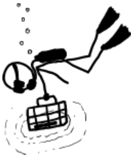
Afbeelding 4. Nucleaire duiker

Door het geluid van alle bubbels in het bassin, hoorde de duiker zijn persoonlijke stralingsalarm niet afgaan. Zodra hij weer bovenwater kwam, gingen alle alarmen in de kamer af. Hij liet zijn gereedschapstas in het water vallen. Later bleek dat de onbekende buis een deel was van een "dry tube", de beschermingshuls die om stralingsmeters heen zit in de kern van de kernreactor. Deze buis was waarschijnlijk per ongeluk afgebroken toen een opslagcapsule in 2006 werd verzegeld, en lag al vier jaar lang onopgemerkt in een hoekje van het bassin.