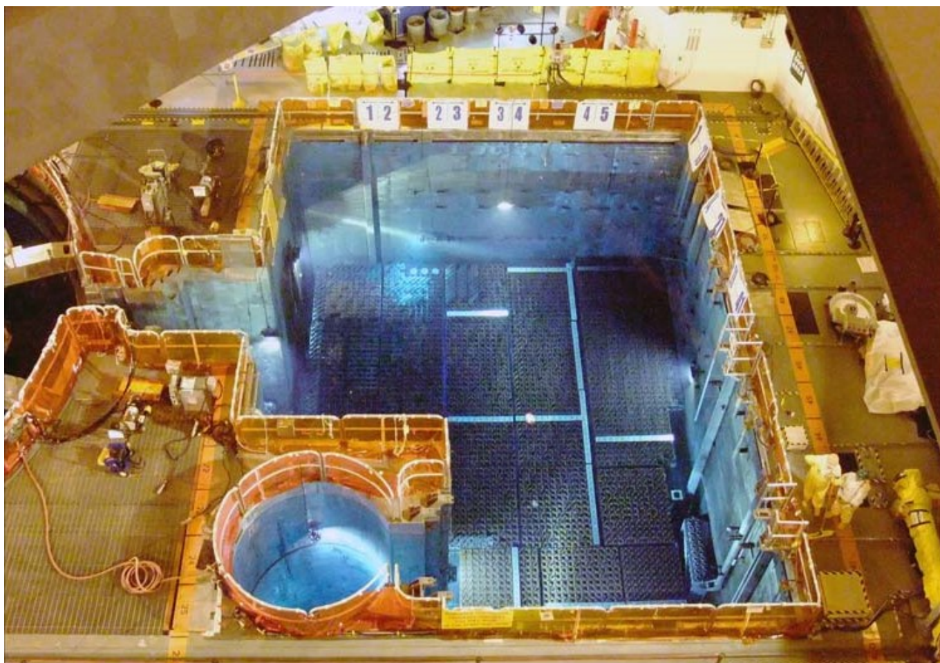
Afbeelding 2. Een splijtstofbassin

Kernreactoren gebruiken de warmte van radioactieve kernsplijting om energie op te wekken. Stiekem werken ze als stoommachines : met de hitte die vrijkomt van het radioactieve verval wordt stoom gemaakt, waarmee turbines worden aangedraaid . Als splijtstof gebruiken deze reactoren kleine, twee centimeter lange keramische uranium- of plutoniumdioxidekorrels die verzegeld zijn in metalen staven. Nadat het bruikbare uranium of plutonium in deze staven op is, zijn de staven nog steeds zeer radioactief. De verbruikte splijtstof is een hoogactieve afvalstof, met veel langlevende radioactieve isotopen die ook nog veel warmte uitstralen.