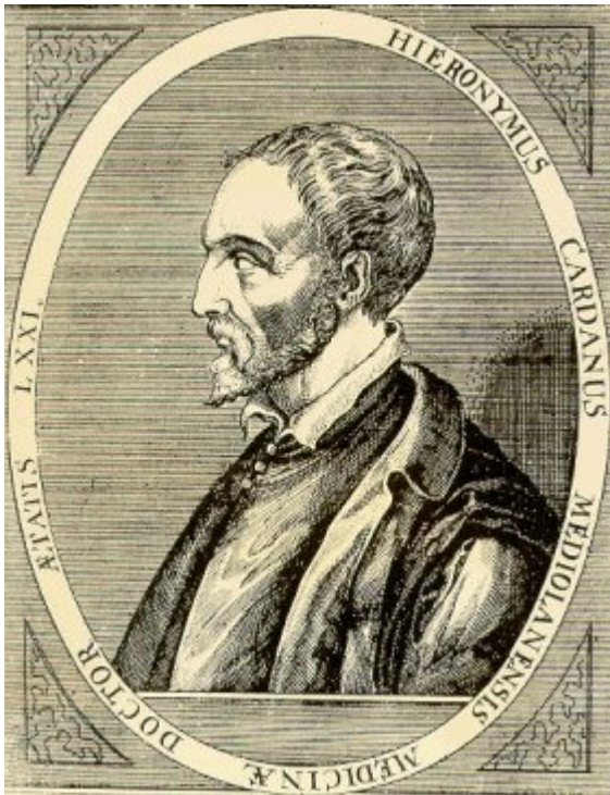
Afbeelding 2. Gerolamo Cardano (1501-1576). Cardano was in 1545 voor zover bekend de eerste die een rudimentaire versie van complexe getallen gebruikte.