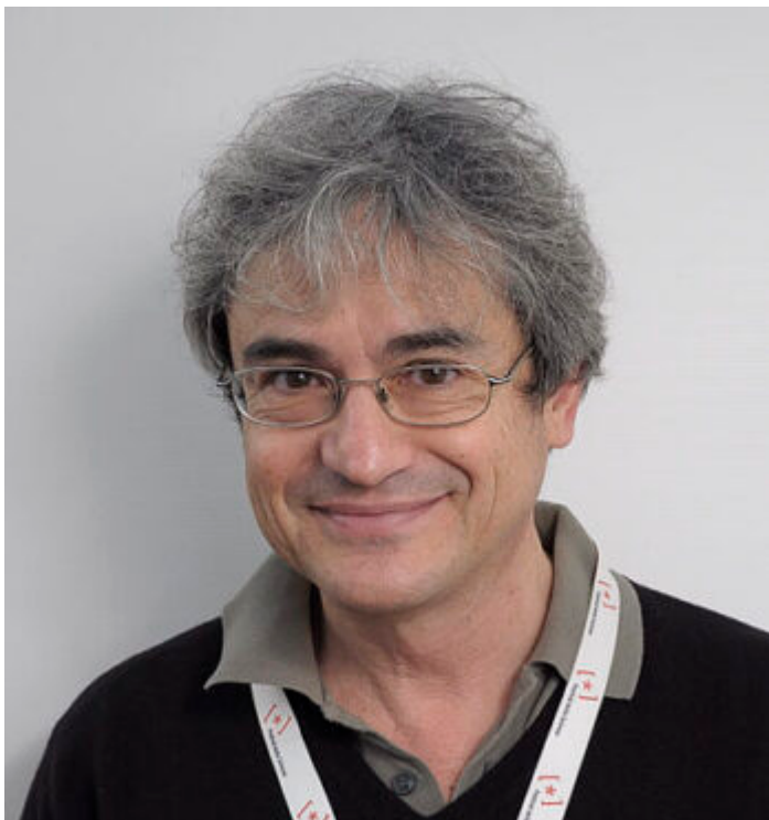
Afbeelding 3. Carlo Rovelli.

eigenschappen van een object die reëel zijn voor een tweede object, dat niet noodzakelijkerwijs zijn voor een derde object. Voor de kat in de doos is er óf gif, óf niet; voor de kat zelf is hij springlevend, of dood. Maar wij bevinden ons buiten de doos en hebben geen interactie met het gif en ook niet met de kat. Voor ons is de kat dus in een ‘superpositie’ van levend en dood. Vanuit het relationele perspectief bezien zijn beide dingen waar: ‘kat is in zuivere toestand (volgens de kat zelf)’, en ‘kat is in superpositie (volgens ons)’.