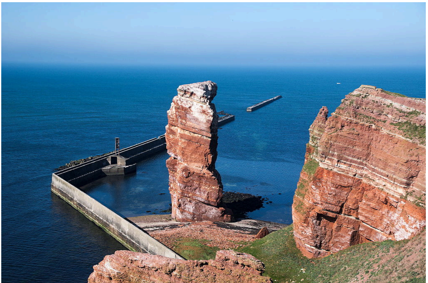
Afbeelding 2. Uitzicht vanaf Helgoland.