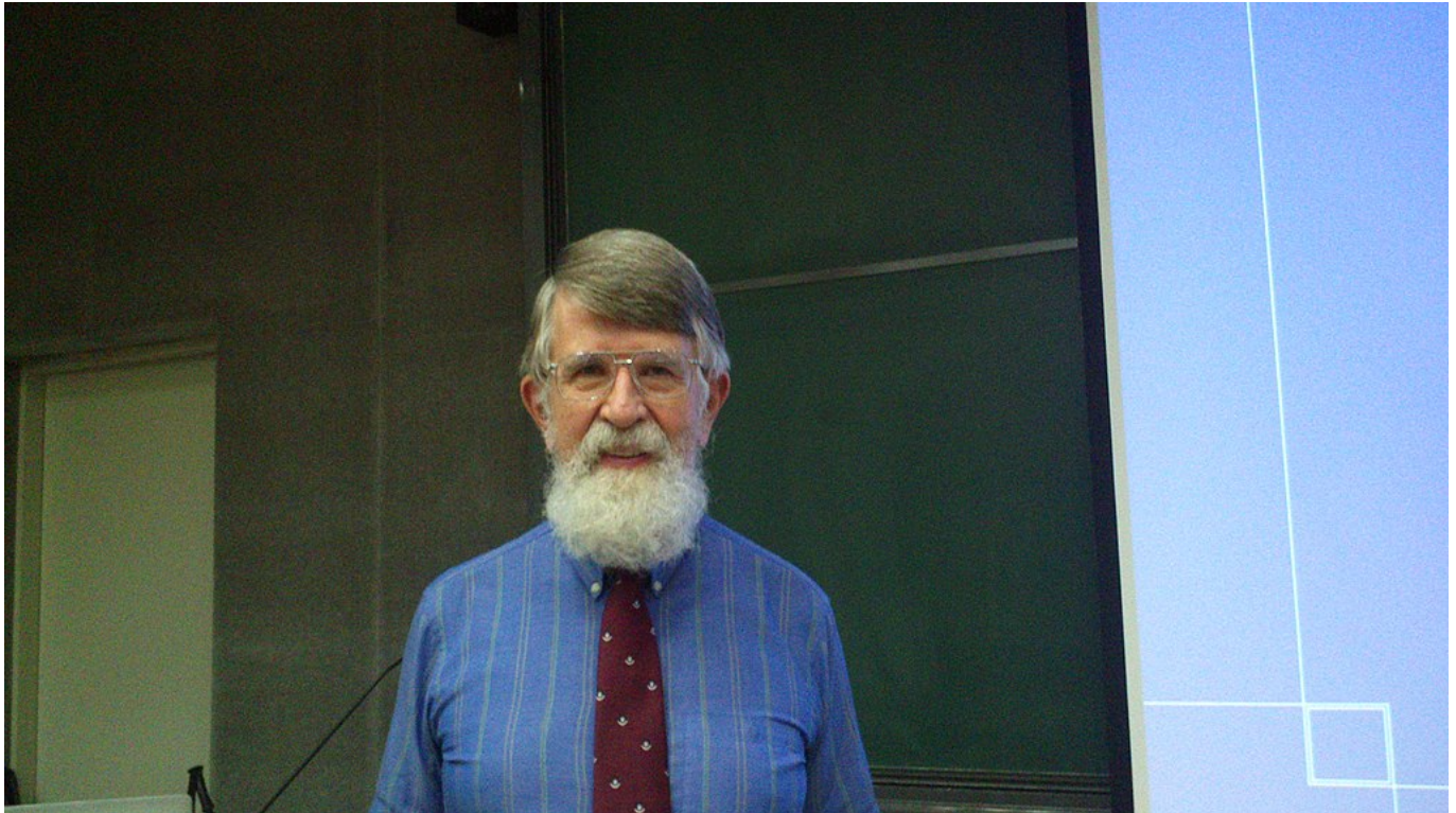
Afbeelding 2. Don Page. De bedenker van de Pagekromme en de Pagetijd.

Don Page, de naamgever van de Pagekromme, schreef in 1993 het wetenschappelijke artikel " Informatie in de (Hawking)straling van zwarte gaten ". In dit werk nam hij aan dat informatie in een zwart gat niet verloren kan gaan, en concludeerde dat de straling van een pasgeboren verdampend (en zwaar) zwart gat nauwelijks informatie bevat over wat er ooit in het zwarte gat is gevallen of wat het ontstaan van het zwarte gat zelf heeft veroorzaakt. Het interessante is, dat Page tegelijkertijd ook liet zien dat op een zeker moment het verdampende zwarte gat een leeftijd bereikt, laten we dit 'oud' noemen, waarop de Hawkingstraling opeens wél informatie bevat over wat het zwarte gat heeft gevormd en wat er ooit in het zwarte gat is gevallen. Een belangrijke aanname daarbij is dat ook het oude zwarte gat nog steeds zwaar moet zijn. Deze overgang van 'jong' naar 'oud', dus ook de overgang van géén informatie kunnen reconstrueren naar wél informatie kunnen reconstrueren, vindt plaats op de zogenaamde Pagetijd .