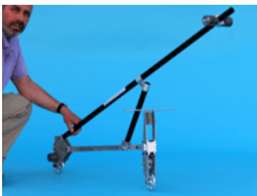
Afbeelding 3: De fietsopstelling van de TU Delft

Maar zijn het gyroscopisch effect en de oriëntatie van het voorwiel dus essentieel voor het fietsen van een fiets? Systematische proeven van de TU Delft (zie bron beneden voor meer informatie) probeerden dit te onderzoeken. De Delftenaren bouwden een fiets waarin er een extra wiel in de tegengestelde richting draait, zodat de totale hoeveelheid impulsmoment van alle wielen bij elkaar verwaarloosbaar is. Met andere woorden, het gyroscopisch effect is dan verwaarloosbaar. Ook plaatsten zij het voorwiel op de destabiliserende wijze aan het stuur. Deze fiets bleek, al zal het niet van harte te zijn geweest, te befietsen te zijn, mits er genoeg voorwaartse snelheid is. Het mysterie is hiermee dus niet opgelost.