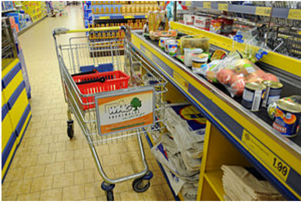
Afbeelding 2: Een winkelwagen met voorwielen

Maar zijn het gyroscopisch effect en de oriëntatie van het voorwiel dus essentieel voor het fietsen van een fiets? Systematische proeven van de TU Delft (zie bron beneden voor meer informatie) probeerden dit te onderzoeken. De Delftenaren bouwden een fiets waarin er een extra wiel in de tegengestelde richting draait, zodat de totale hoeveelheid impulsmoment van alle wielen bij elkaar verwaarloosbaar is. Met andere woorden, het gyroscopisch effect is dan verwaarloosbaar. Ook plaatsten zij het voorwiel op de destabiliserende wijze aan het stuur. Deze fiets bleek, al zal het niet van harte te zijn geweest, te befietsen te zijn, mits er genoeg voorwaartse snelheid is. Het mysterie is hiermee dus niet opgelost.