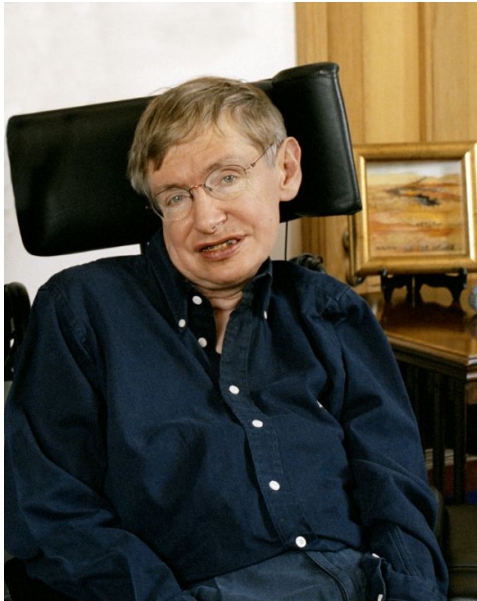
Afbeelding 2. Stephen Hawking Stephen Hawking toonde aan dat een zwart gat straling uitzendt. Hawking en Jacob Bekenstein lieten zien dat een zwart gat ook een entropie heeft, die toeneemt als de oppervlakte toeneemt.

Het blijkt dat van deze twee mogelijkheden de tweede het geval is: een zwart gat heeft inderdaad een grote entropie. Jacob Bekenstein en Stephen Hawking lieten zien dat die entropie evenredig is met het oppervlak van de horizon van het zwarte gat: als het zwarte gat in oppervlakte tweemaal zo groot wordt, wordt de entropie van het zwarte gat óók tweemaal zo groot. Dat resultaat leidt tot een aantal interessante vragen: