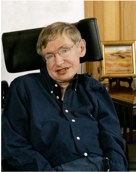
Afbeelding 2. Stephen Hawking Stephen Hawking toonde aan dat een zwart gat straling uitzendt. Hawking en Jacob Bekenstein lieten zien dat een zwart gat ook een entropie heeft, die toeneemt als de oppervlakte toeneemt.

Het blijkt dat van deze twee mogelijkheden de tweede het geval is: een zwart gat heeft inderdaad een grote entropie. Jacob Bekenstein en Stephen Hawking lieten zien dat die entropie evenredig is met het oppervlak van de horizon van het zwarte gat: als het zwarte gat in oppervlakte tweemaal zo groot wordt, wordt de entropie van het zwarte gat óók tweemaal zo groot. Dat resultaat leidt tot een aantal interessante vragen: