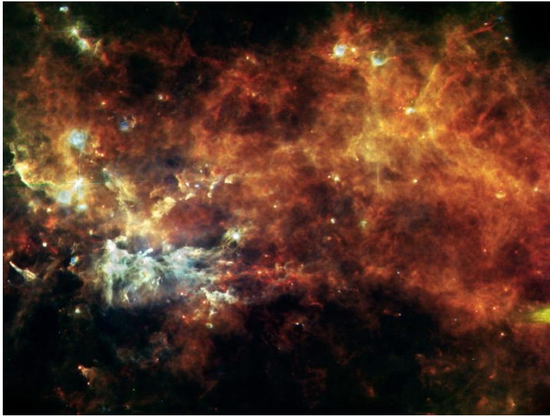
Afbeelding 1. Een stervormingsgebied Gaswolken zoals deze (een stervormingsgebied in het sterrenbeeld Vosje) trekken langzaam samen, totdat compacte sterren gevormd worden. De sterren lijken veel “geordender” dan de gaswolk. Toch neemt ook in dit proces de entropie niet af.

De oorzaak van dit tegenintuïtieve gedrag is de zwaartekracht. Een belangrijk voorbeeld van hoe de zwaartekracht de schijnbare orde kan laten toenemen, noemden we al in het inleidende artikel in dit dossier. Onze zon is zo’n vijf miljard jaar geleden ontstaan uit een wolk van stof en gas. Deze gaswolk trekt door zijn eigen zwaartekracht samen, totdat de dichtheid en daardoor de temperatuur van het gas zo hoog zijn dat kernfusie gaat plaatsvinden, en de compacte bol van gas als een ster licht en warmte gaat uitstralen.