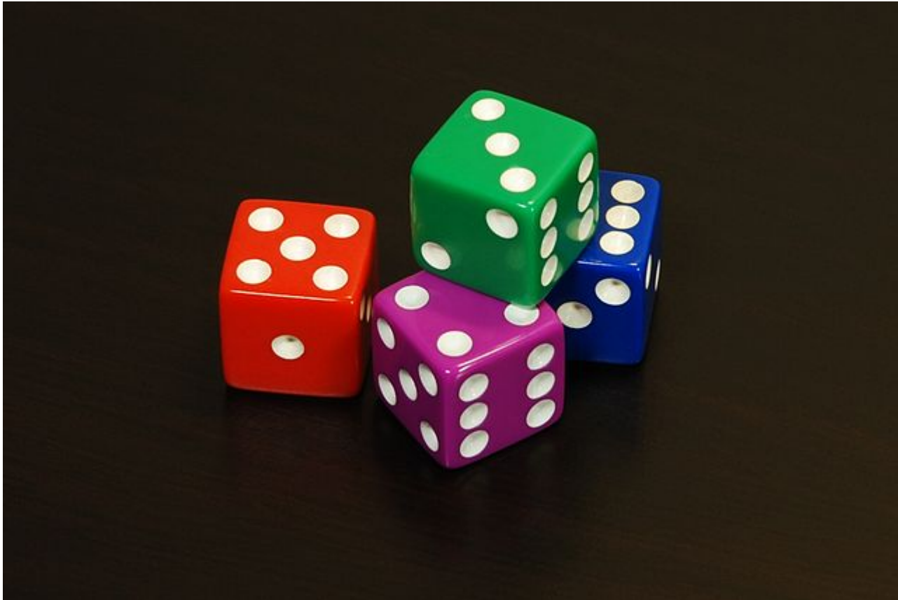
Afbeelding 3. Kansen. Quantumdeeltjes kunnen in een superpositie zijn, waarbij verschillende mogelijke meetuitkomsten elk een bepaalde kans hebben. Waar bij een dobbelsteen de kansen berusten op onze onwetendheid (in principe kunnen we de uitkomst van een bepaalde worp exact voorspellen) zijn in het quantumgeval de uitkomsten echt onbepaald , en de kansen fundamenteel.

In zekere zin bepaalt een meting aan A dus niet alleen iets over A, maar ook iets over B. Sterker nog: als we de quantumkansen serieus nemen beïnvloedt de meting aan deeltje A de toestand van deeltje B. Dit laatste is hetgene waar Einstein problemen mee had. Die beïnvloeding zou namelijk ogenblikkelijk moeten gebeuren, en in het bijzonder dus met een snelheid groter dan die van het licht van deeltje A op deeltje B moeten worden overgedragen. Dat laatste is met name een probleem als we deeltjes A en B voor de meting ver van elkaar verwijderen: dan verwachten we immers dat een signaal van A er enige tijd over zou doen voor het B bereikt – maar óók als we voordat zo'n fictief signaal aankomt deeltje B meten vinden we het juiste antwoord!