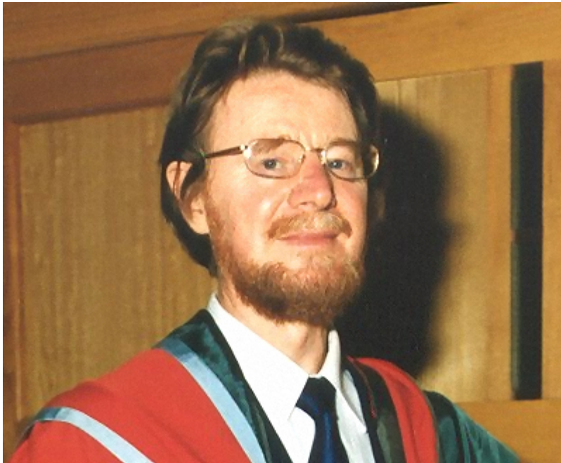
Afbeelding 4. John Bell.

Einstein zelf beseftte zich niet dat zijn model tot andere meetuitkomsten zou leiden dan de gewone quantumtheorie – dat zou pas in 1964 door John Bell worden aangetoond. Bell schreef zijn resultaat in de vorm van een aantal ongelijkheden: bij metingen zouden de frequenties van bepaalde uitkomsten boven een zekere grens liggen als de theorie van verborgen variabelen klopte, maar ruim onder die grens als de gewone quantumfysica klopte.