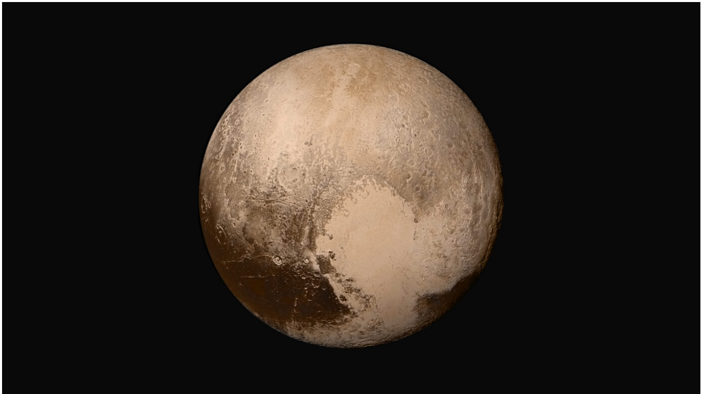
Afbeelding 3. Een planeet? Dwergplaneet Pluto.

Neptunus, want die planeet is waarschijnlijk ergens anders in ons zonnestelsel ontstaan en later naar zijn huidige baan gemigreerd.'