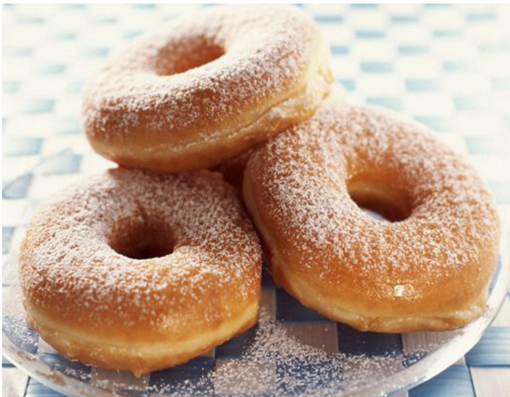
Afbeelding 1. Een donutuniversum? Foto: Salim Virji .

Wat is de vorm van ons heelal? Als je 's nachts naar de sterrenhemel kijkt is dat misschien niet de eerste vraag die bij je opkomt. Toch zijn astronomen enorm geïnteresseerd in dit vraagstuk. Er bestaat een verrassend voorstel voor het antwoord, namelijk dat ons heelal de vorm van een donut heeft. In dit artikel bespreek ik hoe je zo'n driedimensionaal donutuniversum 'maakt' én hoe het is om er in eentje te leven.